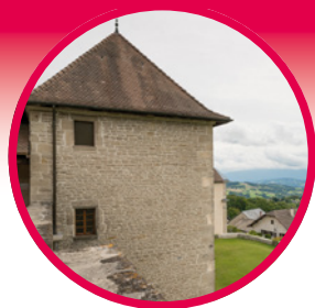
Chateau de Clermont