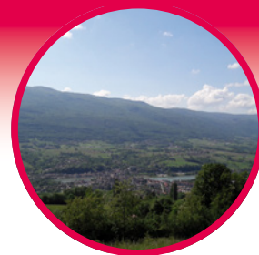
Vue de Seyssel depuis la Montagne des Princes