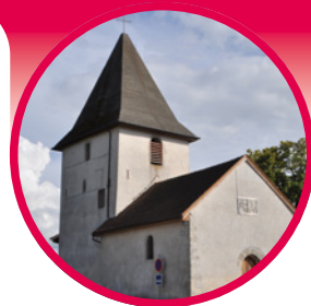
Eglise de Droisy