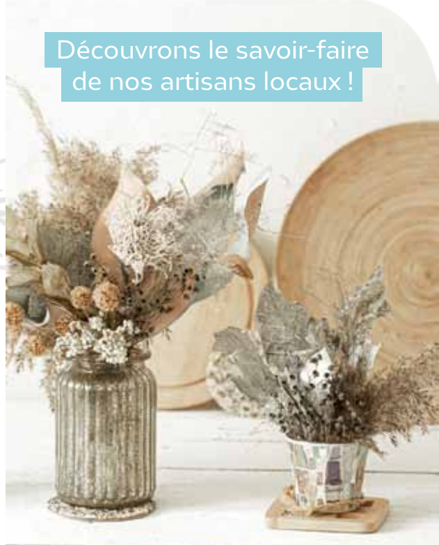
Visuel non contractuel

Découvrons le savoir-faire de nos artisans locaux !