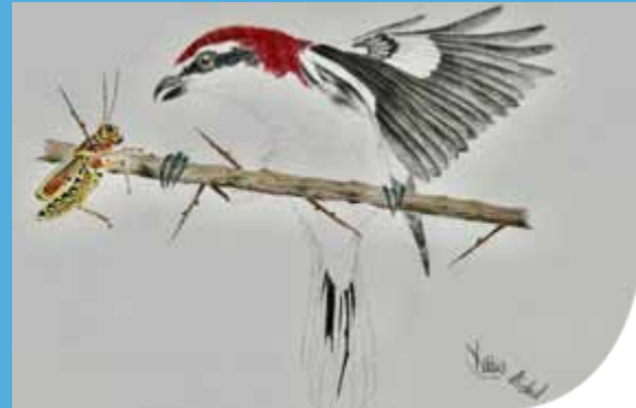
Peinture, Pie-grièche à tête rousse © Michel Dupuis