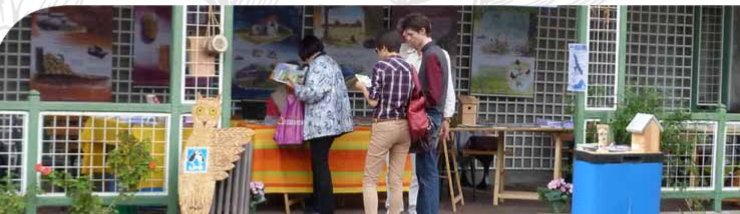
Visuel non contractuel

Co-construisons un territoire où les femmes, les hommes et l'ensemble du vivant cohabitent en harmonie !