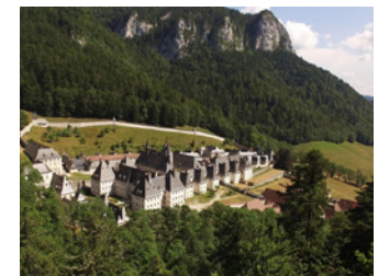
Musée de la Grande Chartreuse