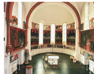
Musée Arcabas en Chartreuse