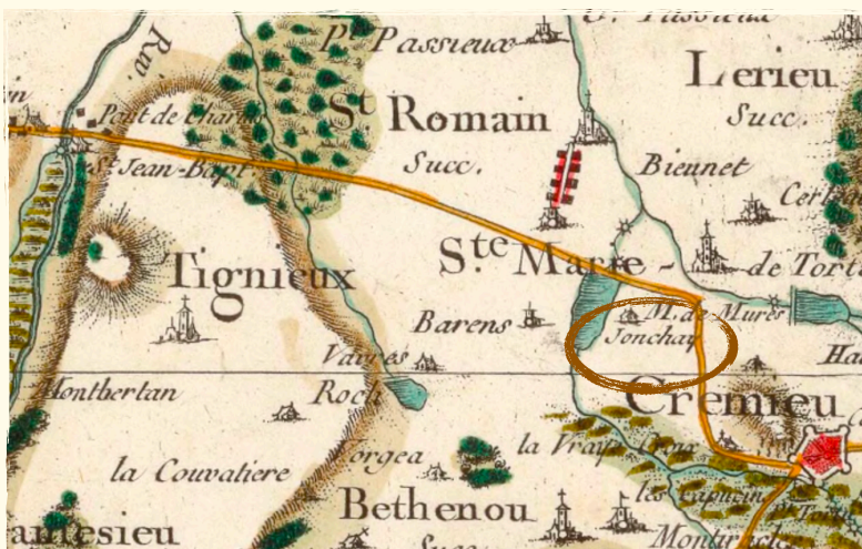
Localisation du Jonchay, extrait de la carte de Cassini, n°118, environs de Belley, vers 1760, Bnf, département Cartes et plans, GE FF-18595 (118).