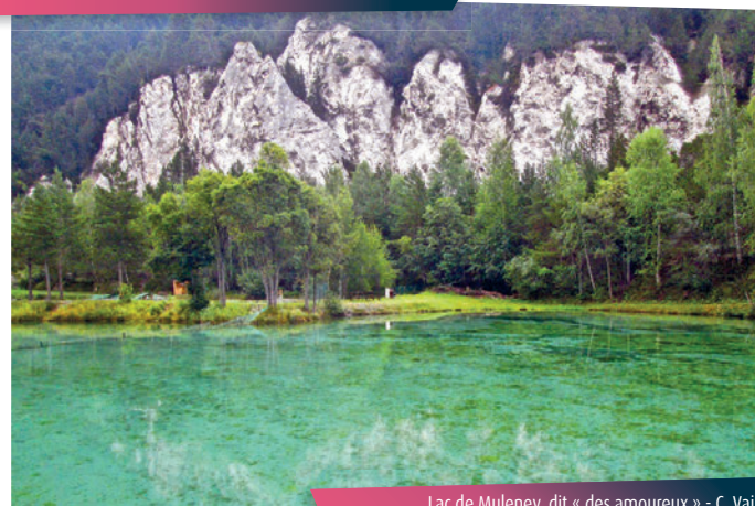
Lac de Muleney, dit « des amoureux » - C. Vair

Au passage dans la combe de Bonnenuit, regardez sur votre gauche. Quelle est cette construction atypique ? Un paravalanche protégeant la vallée des caprices de l'enneigement en hiver. Dame nature se fâche souvent sur ce versant.