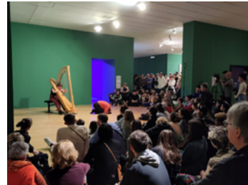
What'Sup, festival du CNSMD au macLYON, 2023

+ pour ponctuer la journée : interventions sonores et musicales proposées par les étudiant·es du CNSMD Lyon (Conservatoire national supérieur de musique et de danse de Lyon)