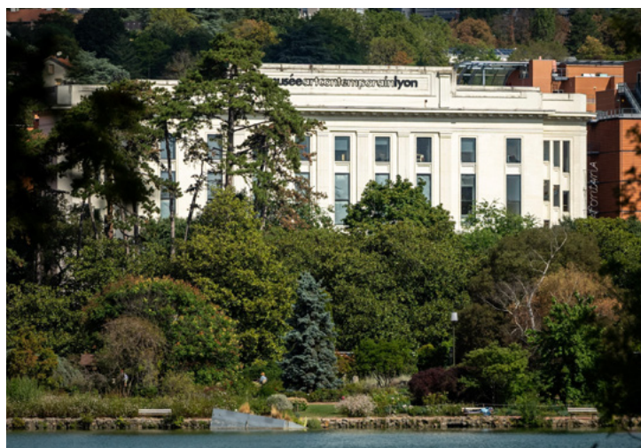
Vue du musée