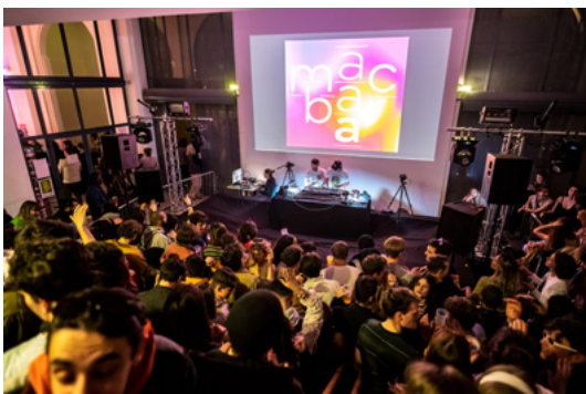
Nocturne étudiante 2023