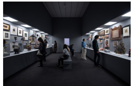
Vue de l'exposition Désordres - Extraits de la collection Antoine de Galbert au macLYON du 8 mars au 7 juillet 2024.

Pensée en étroite collaboration avec Antoine de Galbert, l'exposition rassemble plus de 200 œuvres, montrant ainsi la richesse et la singularité de cette collection au fil d'un parcours divisé en une dizaine de salles sur l'ensemble du 2 e étage du musée.