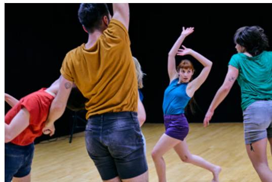
Spirit Desire , CCNR