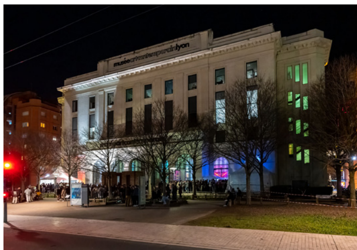
Vue du musée de nuit @ Photo : Lionel Rault

Musée d'art contemporain Cité internationale 81 quai Charles de Gaulle 69006 LYON – France