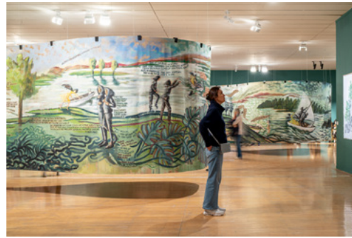
Vue de l'exposition Sylvie Selig, River of No Return au macLYON du 8 mars au 7 juillet 2024.

River of No Return - mesurant 140 mètres de long - se déploie sur l'ensemble du 1 er étage du musée. Autour de cette toile remarquable, de nombreuses œuvres dont sa Weird Family [son étrange famille].