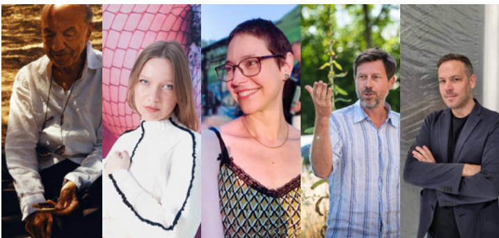
Sarkis © Thierry Lefébure – Marilou Poncin © Marilou Poncin – Nadia Kaabi-Linke © Timo Kaabi-Linke – Jan Kopp - Droits réservés – Matthieu Lelièvre - Droits réservés

Témoignages d'artistes sur la collaboration entre artistes et musée avec Sarkis, Marilou Poncin, Nadia Kaabi-Linke et Jan Kopp. Modération : Matthieu Lelièvre, responsable des collections du macLYON.