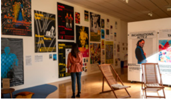
Accrochage sur l'histoire du graphisme du macLYON, novembre 2023