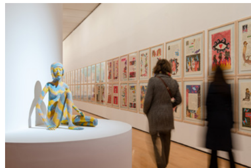
Vue de l'exposition Friends in Love and War – L'Éloge des meilleur-es ennemi-es au macLYON du 8 mars au 7 juillet 2024. Œuvres : Francis Upritchard, Marianne , 2016. British Council Collection + Fabien Verschaere, Seven Days Hotel , 2007. Collection macLYON © Adagp, Paris, 2024.

L'exposition s'intéresse au thème de l'amitié, autour d'une sélection d'œuvres des collections du British Council et du macLYON. Elle présente également les œuvres d'artistes spécialement invité-es, qui entretiennent des liens de longue date avec ces deux villes jumelées : Lyon et Birmingham. À découvrir au 3 e étage.