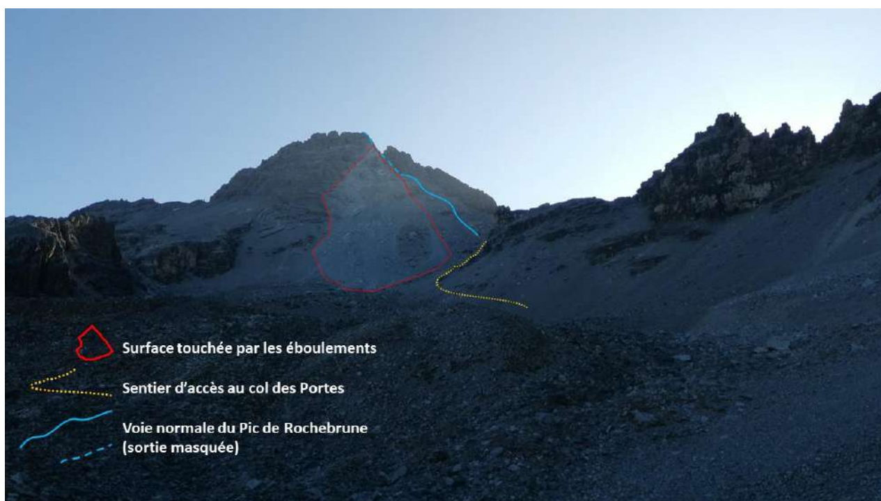
fig. 2 : situation des éboulements, du sentier et de la voie normale (photo RTM05 4/10/23)

L'éroulement principal de l'aiguille fin septembre 2023 n'a également pas atteint la voie normale ni le sentier (altitude minimale atteinte : 2750 m ; distance du sentier : environ 50 m pour les trajectoires les plus rapprochées).