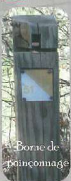
Borne de poinçonnage

L'Orientation à VTT consiste à parcourir 10 à 35 km à VTT en poinçonnant dans l'ordre tous les postes marqués sur la carte. L'élément essentiel est le nombre important de pistes, chemins et routes, qui offrent des choix de cheminements. Se déplacer ainsi entre les postes exige de maintenir constamment la concordance carte terrain à grande vitesse.