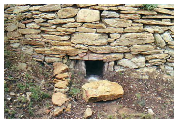
@ Corinne Bonifay