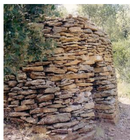
@ Corinne Bonifay