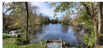
Dans le parc des Ulis