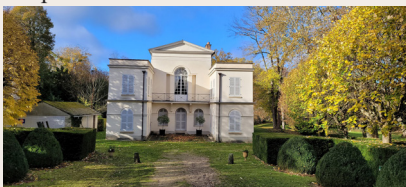
Le Temple de la Gloire

Depuis 2007, l'actuel propriétaire rénove le domaine, et l'ouvre à la visite du 15 juillet au 31 août et aux journées du patrimoine.