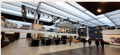
Dans le campus de Paris-Saclay

teur du « Plateau » plus récent où se sont installées récemment des écoles comme : CentraleSupélec, l'Ecole Normale Supérieure, la Faculté de Pharmacie.