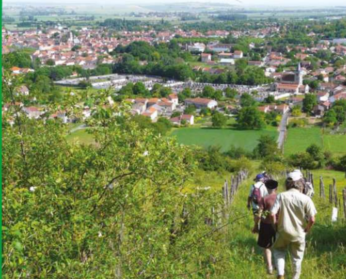
GANNAT DEPUIS LA COLLINE DES CHAPELLES