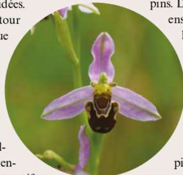
OPHRYIS ABEILLE

Le coteau des Chapelles et ses pelouses calcaires sèches abritent une flore originale composée d'une dizaine d'espèces d'orchidées. Sous la menace d'un retour à la friche, une politique de conservation a été mise en place en 1999, sous l'égide de la commune de Gannat et du conservatoire d'espaces naturels de l'Allier. Sur le site, aujourd'hui labellisé « Espace Naturel Sensible », un pâturage extensif s'est à nouveau implanté.