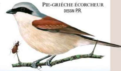
PIE-GRIÈCHE ÉCORCHEUR DESSIN PR.