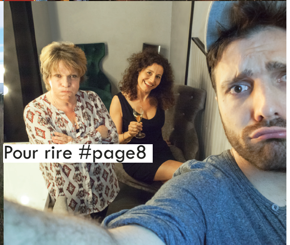
Pour rire #page8