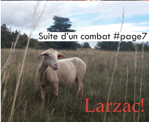
Suite d'un combat #page7