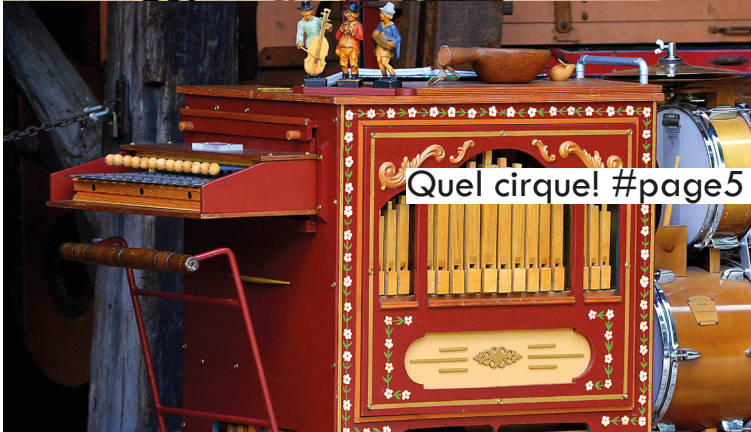
Quel cirque! #page5