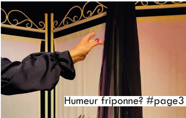
Humeur friponne? #page3