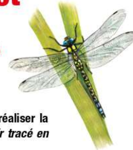
LIBELLULE DESSIN P.R.

Au cœur des grandes plaines, l'Andelot, bordé d'arbres, apporte la fraîcheur de ses rives et la présence bienfaitrice de l'eau.