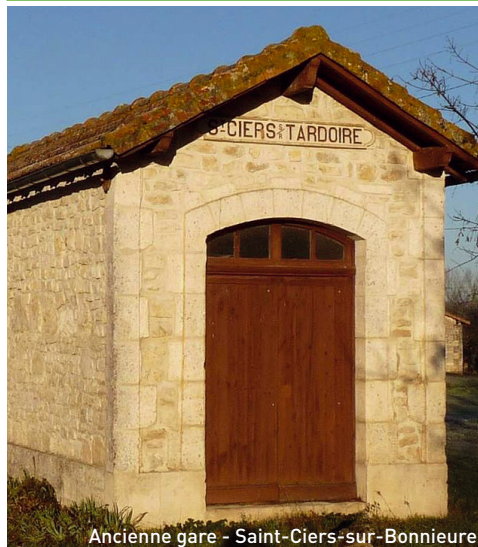
Ancienne gare - Saint-Ciers-sur-Bonniere

Saint-Amant-de-Bonniere, Nanclars : meublés, producteur