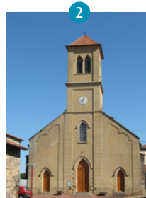
Eglise de Saint Jodard