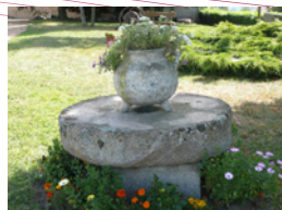
Ancienne meule de moulin