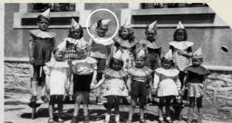
L'école Debelle en 1952-53. Les prémices de la troupe du "Big Bazar"?