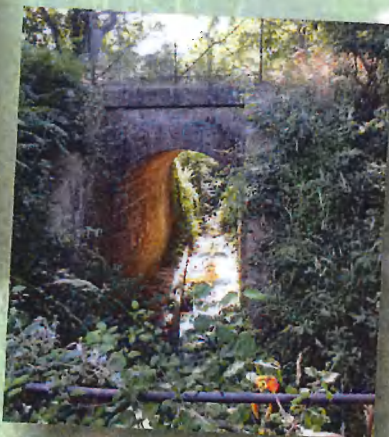
FFRandonnée Gers - Pont SNCF - Véloral