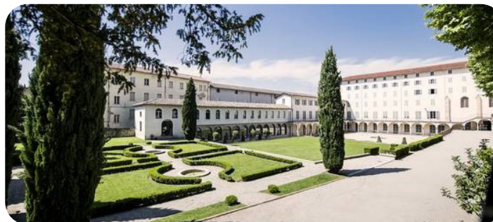
LE MUSÉE DE LA CHAUSSURE

*Sous réserve de modification des tarifs des prestataires et sous réserve de disponibilité au moment de la réservation.