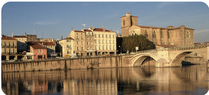
LA COLLEGIALE ST BARNARD