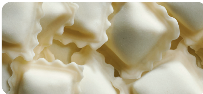
LA CITÉ DE LA RAVIOLE