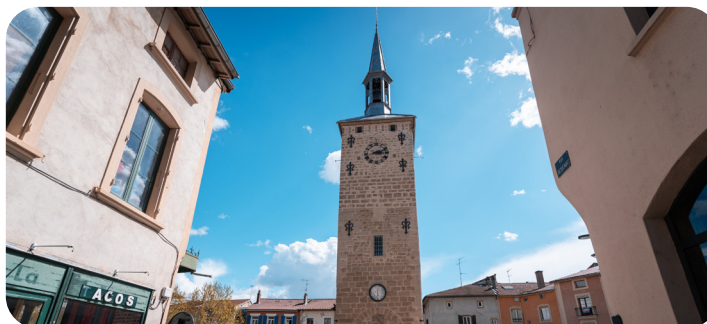
LA TOUR JACQUEMART