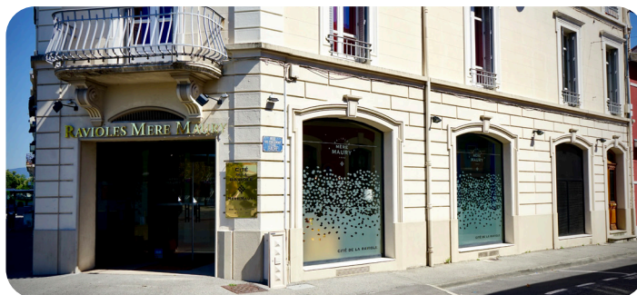
LA CITÉ DE LA RAVIOLE