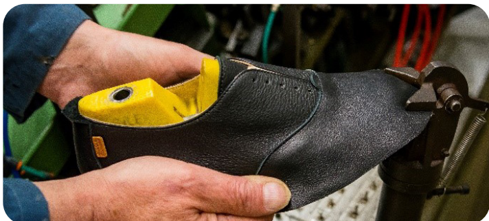
LA CITÉ DE LA CHAUSSURE

*Sous réserve de modification des tarifs des prestataires et sous réserve de disponibilité au moment de la réservation.