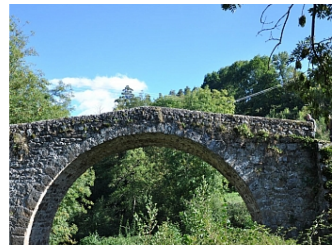
Office de tourisme du Pays de Saint-Félicien