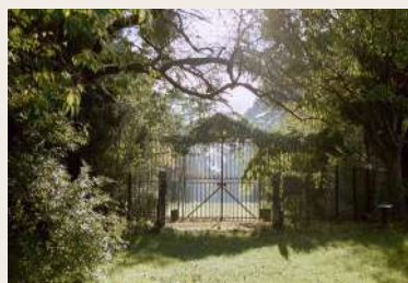
L'arboretum de Verrières-le-Buisson

moulin de Grais, le lac Cambacérés, le parc Louise de Vilmorin, le parc de la maison Vaillant, la place de l'église, la place de la mairie, le centre culturel André Malraux et son musée du Végétal, l'arboretum municipal Roger de Vilmorin, la plaine des Godet et le Bois de Verrières vous conduiront, chacun à sa manière, à travers l'Histoire des relations entre l'Homme et le Végétal.