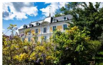
La Maison Vaillant