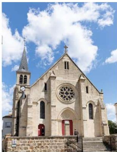
Eglise N-D de l'Assomption