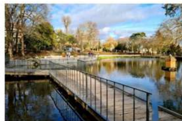
Le lac Cambacérés