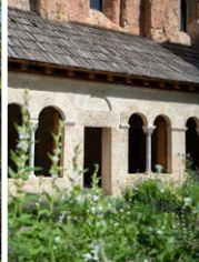
Crots, abbaye de Boscodon