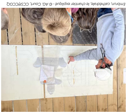
Embrun, cathédrale, le chœur expliqué

Au XVI e siècle, l'orgue prend son essor dans le nord de l'Europe, bénéficiant du développement du protestantisme. Que l'expression soit religieuse ou profane, elle est caractérisée par des musiques à la construction plus élaborée, qui engendreront les grandes pages d'un Bach ou d'un Vivaldi. Org. Ville d'Embrun et Paroisse de l'Embrunais-Savinois