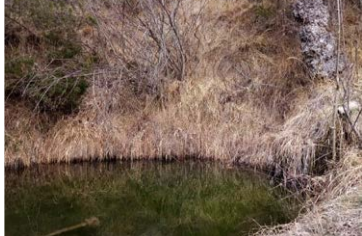
Eyglies, naïs