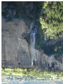
Guillestre, fin du canal de la Chap, vu depuis Mont- Daphin

partenariat avec le Parc national des Écrins (PNE). et leur importance en matière de biodiversité, en pour évoquer les canaux d'irrigation, leur histoire Des actions à destination des scolaires sont menées Levez les yeux !