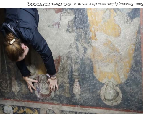
Saint-Sauveur, église, essai de « carton »