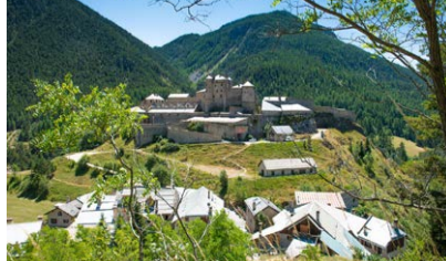
Château-Ville-Vieille, Fort-Queyras

Circuit avec visite de la microcentrale du Rif Bel puis sur le canal de la Chalp : comprendre les enjeux énergétiques et agricoles. Durée : 1h30. Org. Pays Guillestrin / ASA des canaux de Guillestre