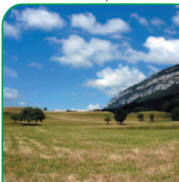
Prairies au pied du Mont Grêle

La forêt couvre aujourd'hui 43,3 % de la surface totale de la commune. Au cours du 19ème s., les cultures ont diminuées au profit des prairies destinées à l'élevage. Aujourd'hui, l'agriculture intensive est tournée vers la production laitière.