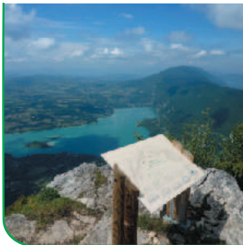
Le lac d'Aiguebelette depuis le Mont Grêle.

Les glaciers disparus, le lac était plus étendu qu'actuellement : ses dimensions ont été réduites par l'apport d'alluvions provenant des affluents, formant les marais au nord et au sud du lac.