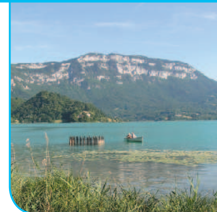
Le Mont Grêle vu du lac