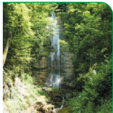
Cascade de la Pissoire, un petit détour au sommet de la route forestière