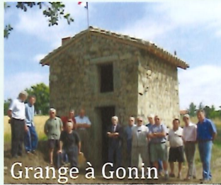
Grange à Gonin