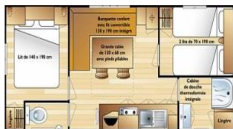
Mobil-home Domino « Climatisé » 5 pers. max

2 chambres avec penderie : 1 lit (140X190), 2 lits (70X190) Salon convertible. douche lavabo, WC séparé , kitchenette avec frigo 26 M 2 (7mx3,70m)