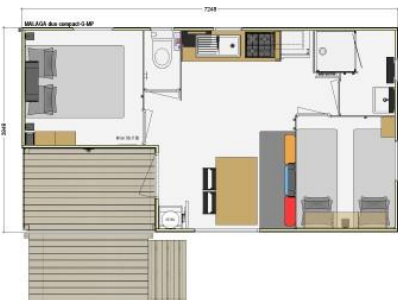
Mobil-home Malaga « Climatisé » 4 pers. max

2 chambres avec penderie : 1 lit (140X190), 2 lits (80X190) Salon avec banquette. douche lavabo, WC séparé, kitchenette avec frigo Terrasse 29 M 2 4X7.70