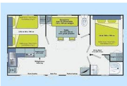
Mobil-home Riviera « Climatisé » 4 pers. max

-Les arrivées se font à partir de 16h et les départs avant 11h.