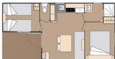
Mobil-home S Mercure « Climatisé » 4 pers. max

2 chambres avec penderie : 1 lit (140X190), 2 lits (70X190) Salon convertible. douche lavabo, WC séparé , kitchenette avec frigo Terrasse 28 M 2 3.8X7.30