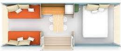
« Cocosweet » Toilé 4 pers.

2 chambres : 1 lit (140X190), 2 lits (70X190) , kitchenette avec frigo, micro-onde Terrasse