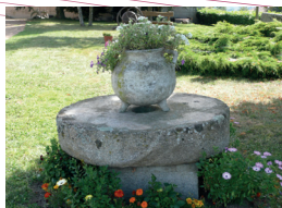
Ancienne meule de moulin