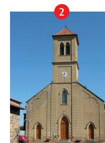
Eglise de Saint Jodard