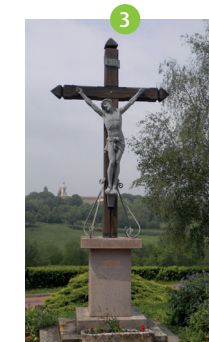
Croix de mission