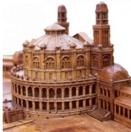
Œuvre du musée A. Brun