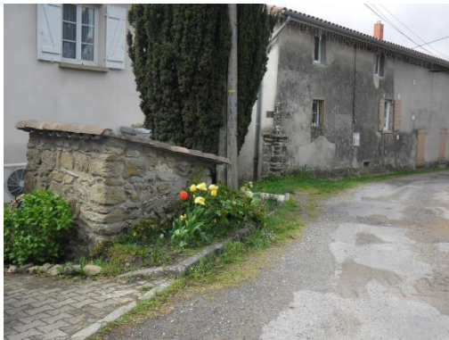
Hameau du Charmillon Croix au sud du village

N°6 : À 10 mètres sur votre droite à l'angle d'une maison, une croix qui joue son rôle de canalisation d'énergie (selon le principe de philosophie de vie du Feng-Shui, permettant de vivre en harmonie avec la nature), et un puits à proximité.