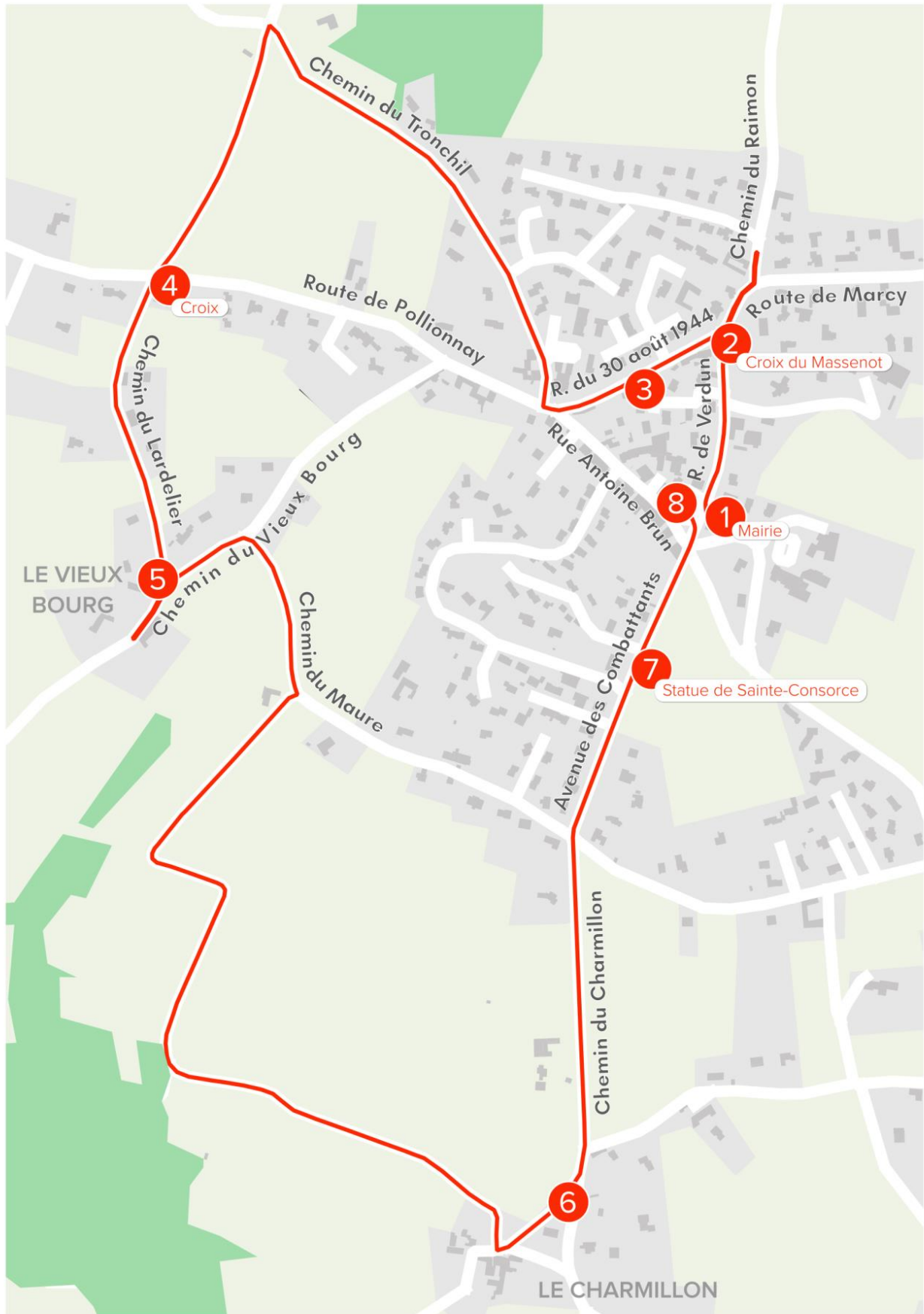
Plan-carte avec les étapes