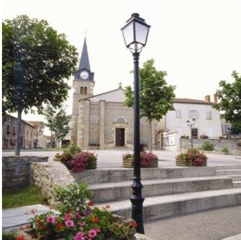
Place de l'église