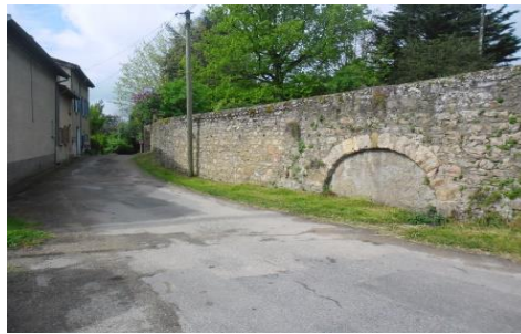
Au Vieux Bourg

Remarquez la perspective sur Les Monts du Lyonnais et sur les 3 cols : Croix du Ban, de La Luère et Malval : Saurez-vous les situer ?