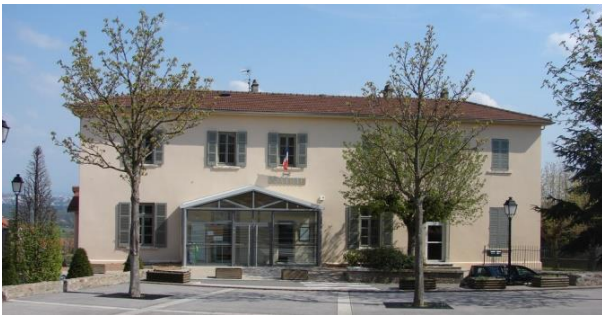
La mairie actuelle