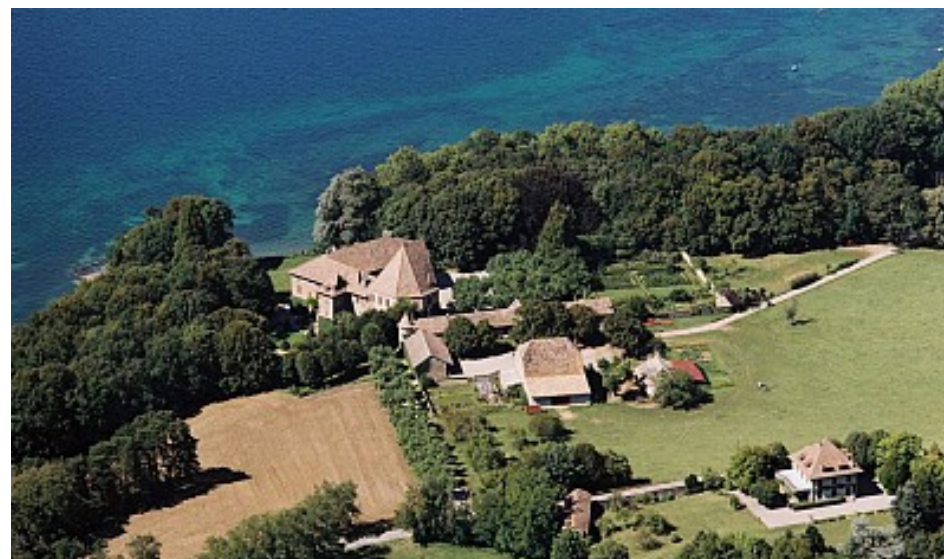
Mairie de Chens-sur-Léman

Château privé, seuls le parc et les jardins se visitent durant la saison estivale