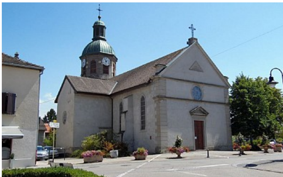
Mairie de Chens-sur-Léman

Une ancienne église est présente sur le hameau de Cusy, siège du centre paroissial. L'édifice est alors placé sous le vocable de Notre-Dame, et était de la collation de l'abbaye d'Abondance. Pendant la Révolution, l'église alors desservie par le curé d'Hermance, fut incendiée puis fut reconstruite en 1827 au chef-lieu d'après un style néo-classique sarde. Une cloche portant une inscription et datant de 1566 et donné à la paroisse en 1804 est protégée depuis 1942.