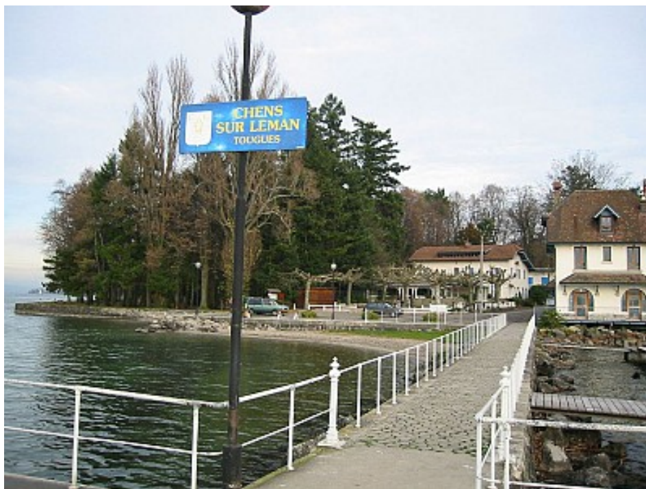
Mairie de Chens-sur-Léman

Vestiges archéologiques de la cité lacustre dite "palafitte" du Port de Tougues (classés au Patrimoine Mondial de l'UNESCO): enfouis dans les fonds lacustres du lac Léman, ces vestiges témoignent d'une station littorale préhistorique ( entre le XIIe et le Xe siècle avec J.C).