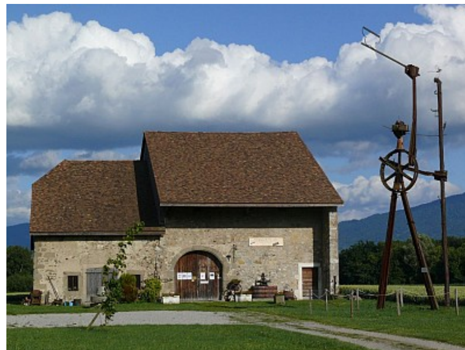
Art et Culture

Les Granges de Servette abritent une collection permanente d'art contemporain et d'outils anciens dans une grange caractéristique de l'architecture savoyarde s'enrichissant, chaque saison, d'expositions temporaires destinées à faire connaître de jeunes artistes. Parcours ludique pour les enfants.