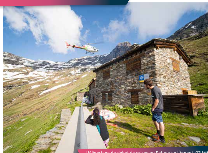
Hélicoptage de début de saison au Refuge de l'Arpont. OTHMV