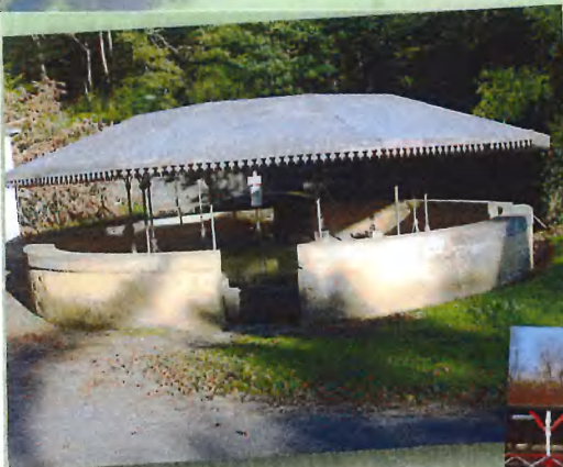
Tourisme Nogaro - Lavoir de Manciet