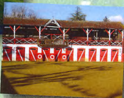
Tourisme Nogaro - Arènes de Manciet

Suivant une ligne de crête, cette belle boucle offre des points de vue sur la campagne et les Pyrénées. Le gîte d'étape du hameau de Sauboire permet une halte agréable.