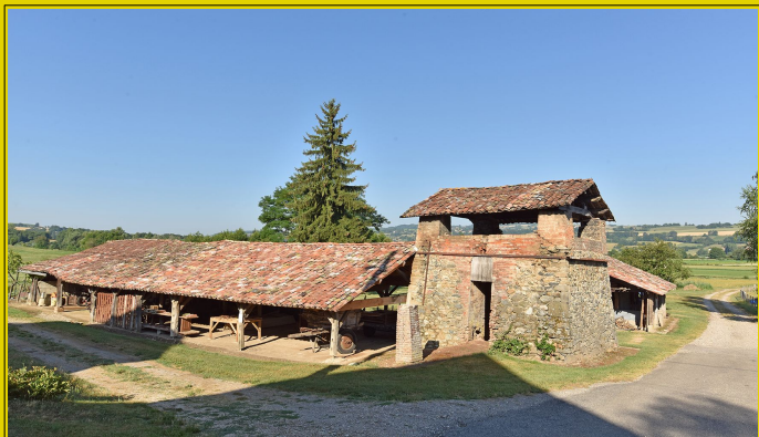
Tuilerie Bertrand à Doissin - juin 2018

Cet ensemble patrimonial du XIX e siècle, particulièrement cohérent et unique en Isère, comprend encore l'essentiel de ses installations et abrite les principaux outils de fabrication. Trois générations y ont assuré la production courante de tuiles mécaniques, plates ou creuses, et plus occasionnellement celle de briques et de carreaux de terre cuite. L'intérêt patrimonial de ce site a été reconnu par le Conseil Départemental de l'Isère avec l'attribution en 2008 du label patrimoine en Isère .