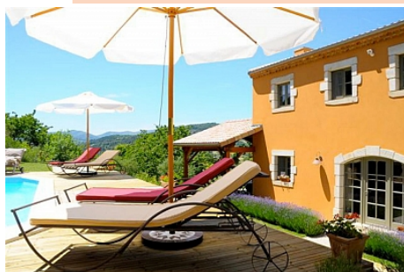
Bastide de Fontaille