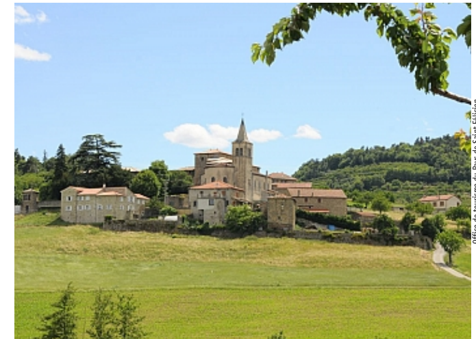
Office de tourisme du Pays de Saint-Félicien