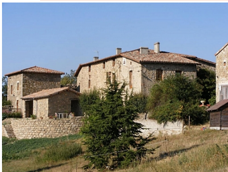
SCI Les Chuchoteurs