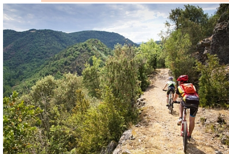
Ardèche Verte Tourisme