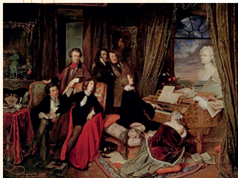
DANHAUSER JOSEF, Franz Liszt au piano