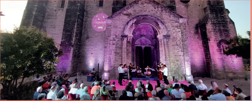
Le Thor, juillet 2025