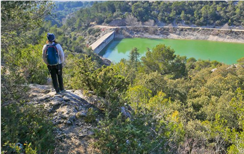
Randonnée au lac du Paty