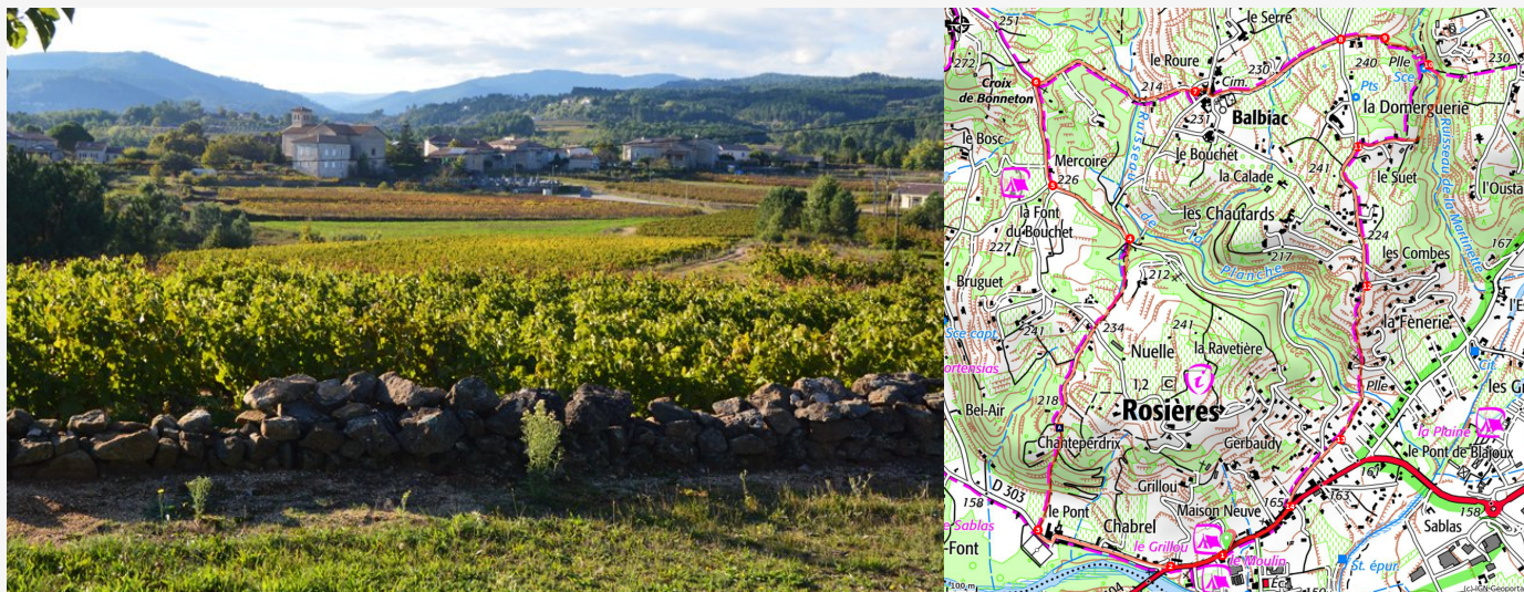
Le Chatus (PNRMA)

Une belle randonnée dans un haut-lieu du vignoble du Parc des Monts d'Ardèche qui vous emmènera au cœur des terrasses de Chatus.