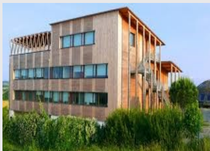
Ecocert : contrôle et certification des produits bio

Abordable par tous, ce parcours de 26 km offre de beaux panoramiques. Vous longez la Save, jusqu'au moulin dit "des Templiers" à Marestaing dans un cadre champêtre ombragé. Puis le parcours passe en rive droite - ATTENTION à la traversée de la Départementale- et s'élève vers la motte féodale de Blanquefort à Auradé. La motte a résisté au temps et domine l'horizon de son mystère.