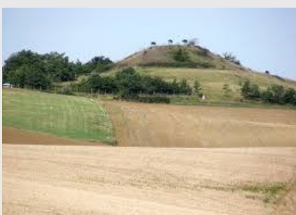
Auradé : La motte féodale de Blanquefort a résisté au temps et domine l'horizon de son mystère.