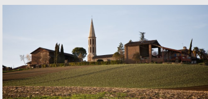
Marestaing : à découvrir au pied du village, en bordure de Save, le moulin dit "des templiers" qui offre un cadre champêtre, très apprécié des pêcheurs.