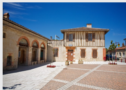
Endoufielle : ce castelneau est entouré de murailles. L'église construite sur un promontoire à un clocher-mur à cinq ouvertures, muni de trois cloches.