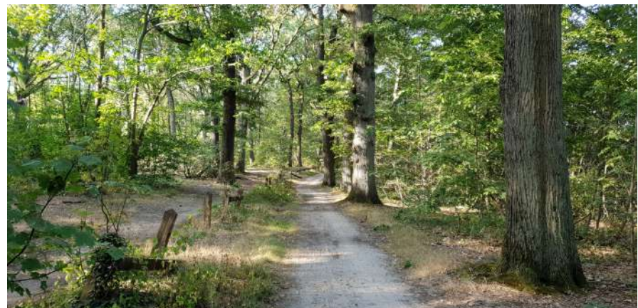
Au milieu de la forêt

Poursuivre par l'allée forestière qui descend en lacets jusqu'à un terre-plein. Prendre à droite et descendre dans un vallon. Passer un petit pont de bois puis remonter en face. Atteindre une large allée que l'on prend à gauche et qui conduit en longeant la bordure du plateau jusqu'au carrefour de Montauzin.