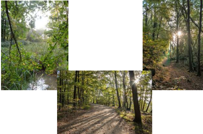
La forêt de Verrières