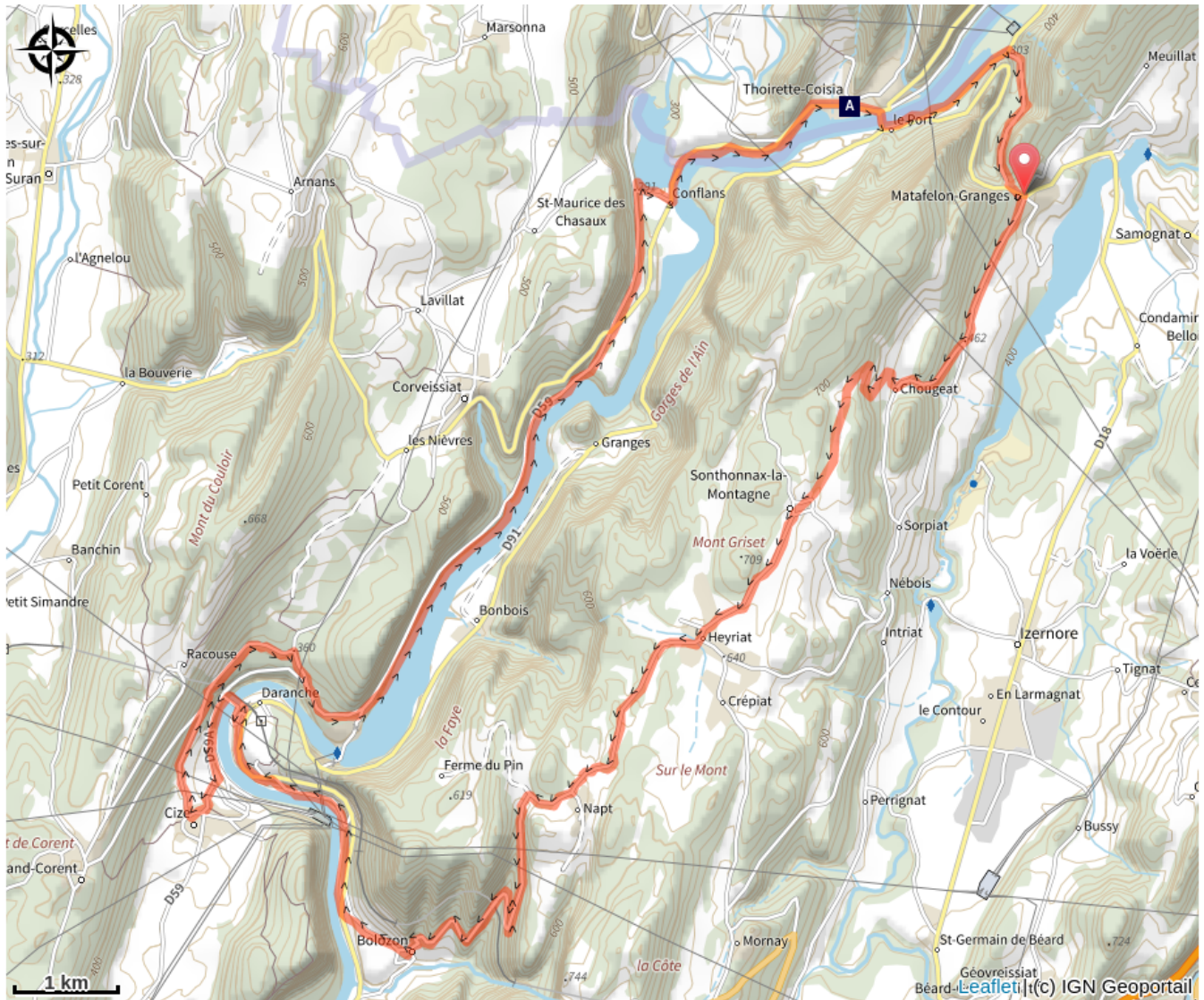
La Lône (A)