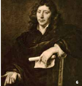
6. Jean Racine