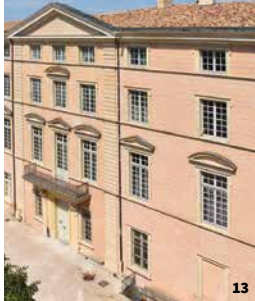
13. Ancien évêché