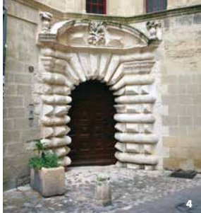
4. Porte de l'hôtel Pontanel