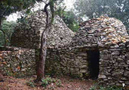
7. Sentier des capitelles