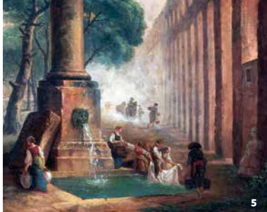
5. La fontaine, Hubert Robert