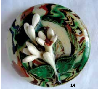
14. Collection Pichon