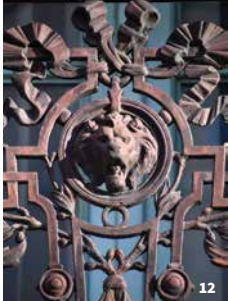
12. Balcon d'Uzès