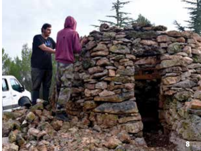
8. Chantier de rénovation

Pour les plus courageux vous pouvez partir du centre d'Uzès pour rejoindre le point de rendez-vous par le Parc du Duché. Comptez 30 mn et 60m de dénivelé supplémentaires !