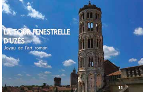
LA TOUR FENESTRELLE D'UZÈS