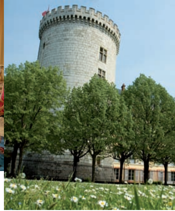
La Tour demi-ronde.