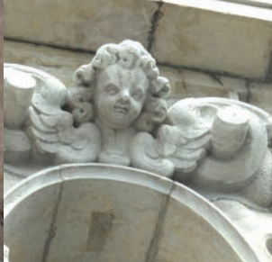
Détail de la façade.