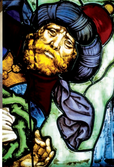
Détail des grandes verrières de la Sainte-Chapelle.