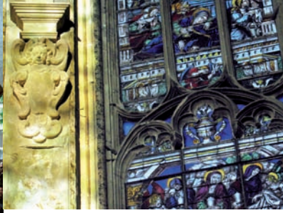
Grandes verrières de la Sainte-Chapelle.