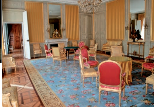
le Salon jaune et son mobilier précieux.