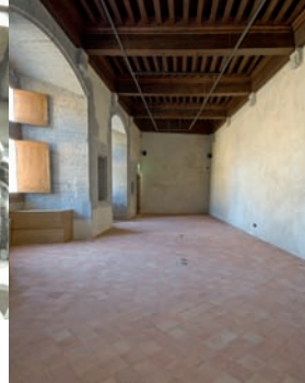
Salles rénovées de la Chambre des comptes.