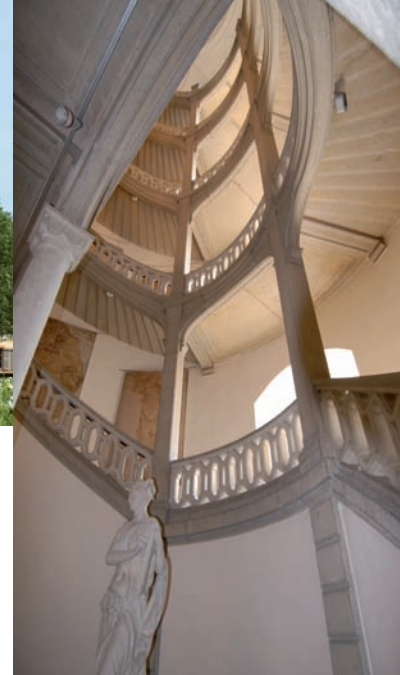
Le grand escalier de la Tour demi-ronde.