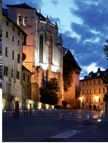
Place du château.