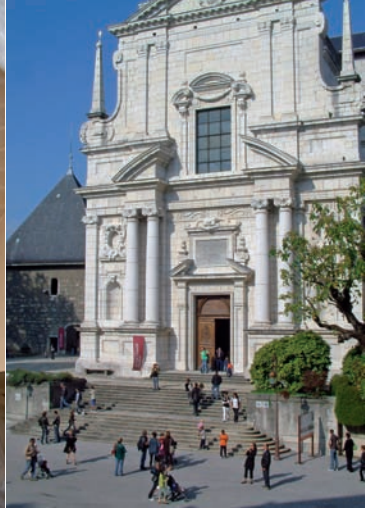
Façade baroque de la Sainte-Chapelle.