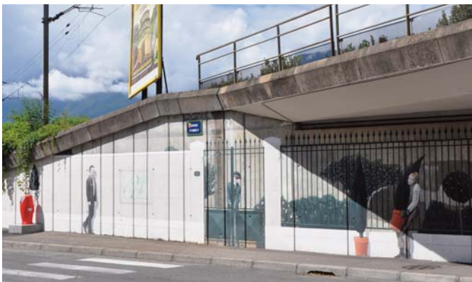
Les fresques et trompe-l'œil contemporains d'Aix-les-Bains ont été réalisés par Miami, Bodet, Annie Berthet, Franck Lloberes, Serge Marie, Denis Boywd et les enfants des écoles, Pierre Rault et ses élèves, X.