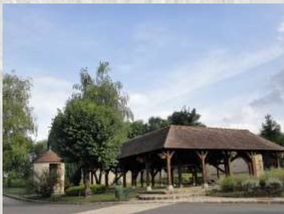
Valence-en-Brie : lavoir

A Echou, la ferme de la Recette possède un ancien colombier au toit à pans coupés. Au Moyen Age, les moines y engrangeaient leur récolte bien avant qu'elle ne deviennent une ferme-auberge. Le bois d'Echou recèle deux chênes remarquables près du carrefour du Pavé-de-Boulains. La faune (faisans, lapins de garenne, sangliers, cerfs et biches) et la flore, protégées y sont diversifiées. Le gouffre de La Sablière à l'est du bois fait partie des curiosités naturelles.