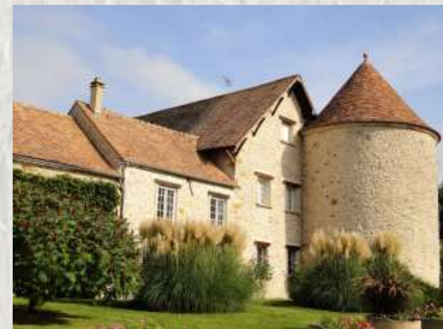
Ferme du château Valence-en-Brie

Les moines mirent en valeur les richesses de la forêt d'Echou et des champs environnants avec leurs céréales. La ferme de la Recette en témoigne, parmi les fermes fortifiées de la région.