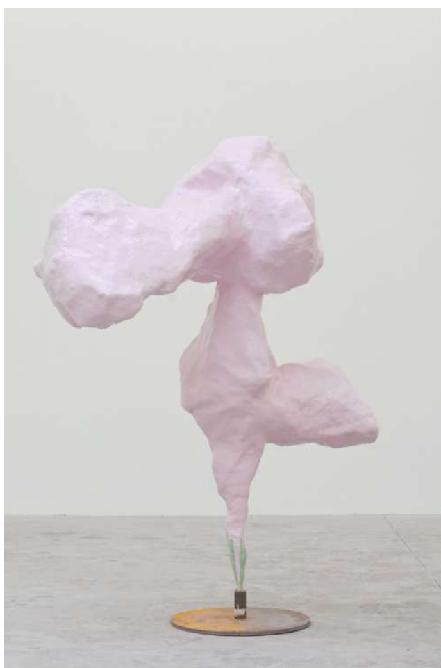
O.T, Franz West

Inclassable, comptant près de six mille pièces aujourd'hui répertoriées, son œuvre n'a cessé de brouiller les frontières entre l'art et la vie, entendue dans sa dimension la plus triviale. Il a aussi constamment joué entre le populaire et le cultivé, l'actif et le contemplatif, l'individuel et le collectif, l'intuitif et l'intellectuel, ou encore l'art et l'artisanat.