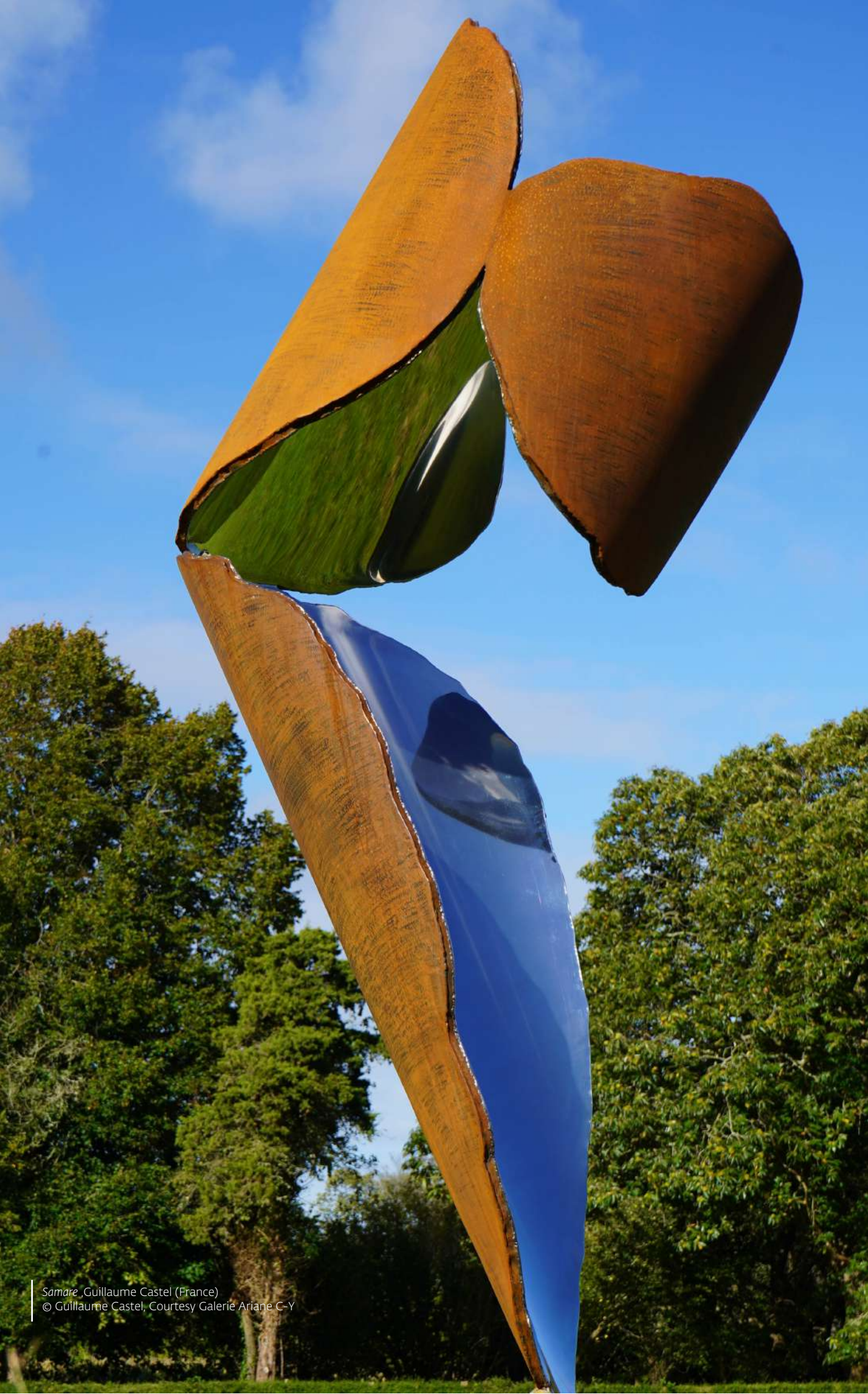
Samare , Guillaume Castel (France)