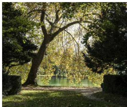
Jardin Anglais

Précédée d'une série de jardins créés depuis le règne de François I er , avec le jardin des Pins dont la grotte des Pins est aujourd'hui le dernier vestige, le jardin Anglais tel que le visiteur le découvre aujourd'hui est un écrin de 11 hectares conçu à partir de 1811 par l'architecte Maximilien Joseph Hurtault, sous Napoléon I er . Si l'Empereur n'appréciait pas particulièrement les jardins « à l'anglaise », il correspond toutefois à une mode paysagère prisée sous le Premier Empire. Au fond de ce jardin se trouve toujours le manège de Sénarmon voulu par Napoléon I er , devenu aujourd'hui l'École militaire d'équitation (EME).