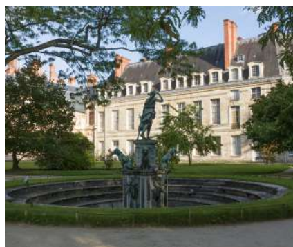
Jardin de Diane

Le jardin de Diane est bordé par le jeu de Paume et par la galerie des Cerfs, mesurant près de 74 mètres et ornée de 43 trophées de chasse installés en 1642.