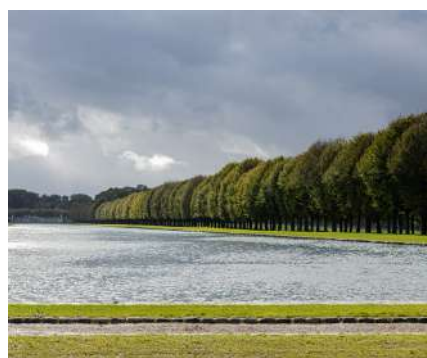
Grand Canal

La légende raconte qu'il fallut plus d'une semaine pour remplir le Grand Canal, n'en déplaise au roi Henri IV, qui avait parié sur deux jours de remplissage contre François de Bassompierre. Le roi y perdit ses 1000 écus !