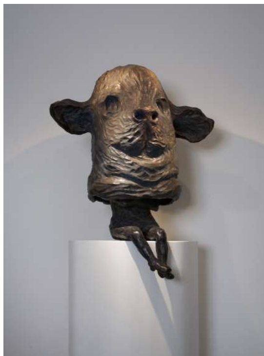
La Sentinelle , Françoise Péetrovitch © Adagp, Paris, 2025, Bertrand Michau

Née en 1964 à Paris, Françoise Péetrovitch vit et travaille entre Cachan et Verneuil-d'Avre-et-d'Iton. Depuis les années 1990, elle façonne l'une des œuvres les plus puissantes de la scène française. Se mesurant aux motifs incontournables de la « grande peinture », elle révèle un monde ambigu, volontiers transgressif, se jouant des frontières conventionnelles et échappant à toute interprétation. L'intime, la disparition, les thèmes du double et de la cruauté traversent son œuvre dont l'atmosphère, tour à tour lumineuse ou nocturne, laisse rarement le spectateur indemne.