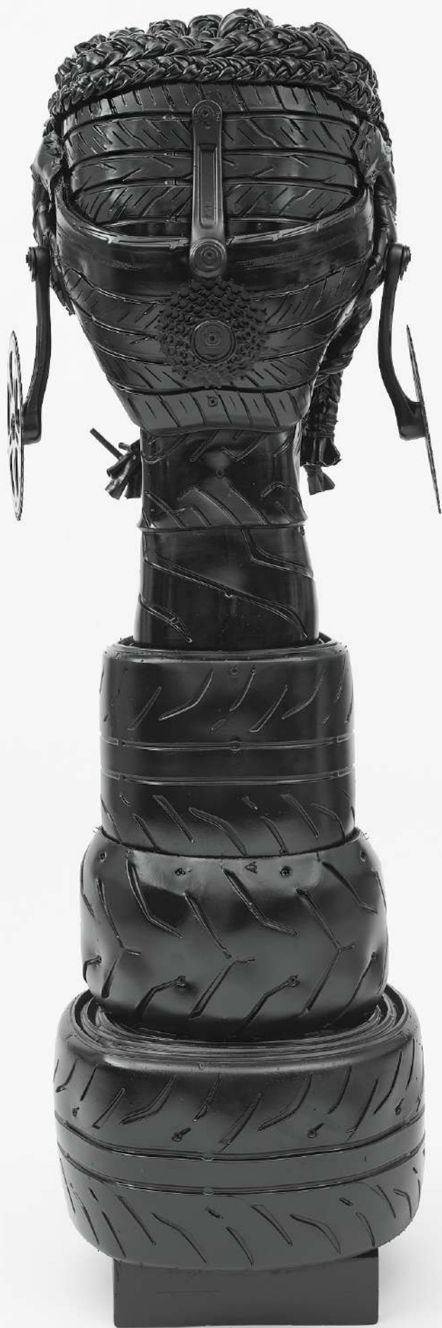
À gauche : Sojourner , Kim Dacres En haut, à droite : I like America (J'aime l'Amérique) , Mounir Fatmi En bas, à droite : Habitacle-cabane , Sara Favriau