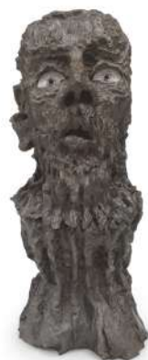
Atlas , Jean-Marie Appriou © Jean-Marie Appriou, Cnap, Fabrice Lindor

Né en 1986 à Brest, Jean-Marie Appriou vit et travaille à Paris. Les sculptures de Jean-Marie Appriou évoquent des formes archaïques et s'inspirent de mondes contemporains mais aussi mythologiques et futuristes. Ses œuvres sont souvent réalisées en aluminium et bronze, dont l'artiste développe les possibilités de conception par l'expérimentation des finitions et la combinaison avec d'autres matériaux, y compris le verre soufflé. En faisant allusion à des formes familières, qu'elles soient animales ou humaines, et en développant son approche unique, presque alchimique de sa matière source, Jean-Marie Appriou a créé sa propre mythologie.