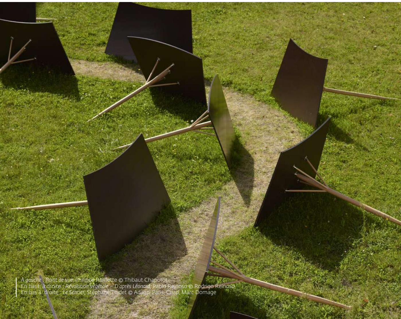
À gauche : Point de vue , Philippe Ramette En haut, à droite : Révolution végétale - D'après Léonard , Pablo Reinoso En bas à droite : Le Sentier , Stéphane Thidet