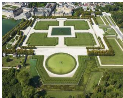
Grand Parterre