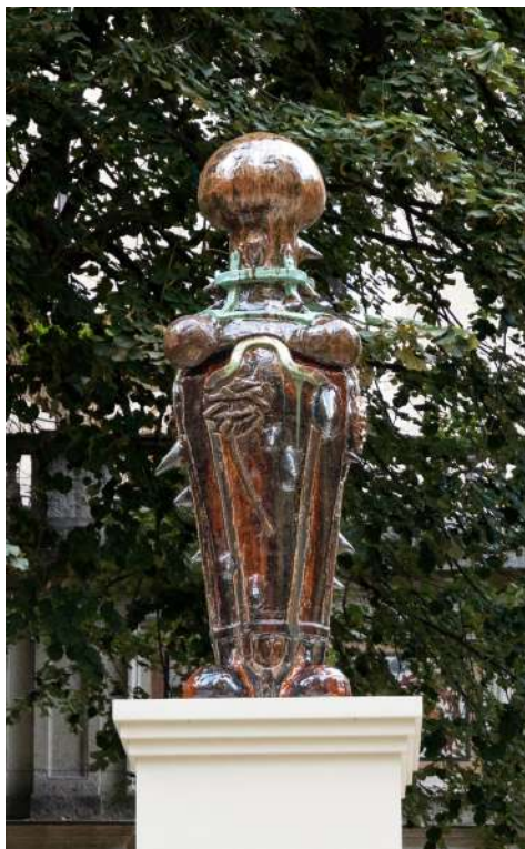
Rest in Rose , Florian Mermin Production La Biennale de Lyon 2024 © Adagp, Elyes Esserhane

Nourri de références cinématographiques, littéraires et philosophiques, de Jean-Jacques Rousseau à Edgar Allan Poe et Jean Cocteau, le travail de Florian Mermin cherche à réconcilier l'objet et l'humain, le réel et l'imaginaire, l'animé et l'inanimé, l'intérieur et l'extérieur. Ses installations immersives, qui convoquent les cinq sens — vue, toucher, goût, ouïe et odorat —, explorent les possibilités plastiques et poétiques du vivant. Associées à des plantes naturelles ou factices, des fleurs fraîches ou séchées, ses sculptures et céramiques empruntent à l'esthétique de l'hybride grâce à la rencontre d'univers fantastiques et la recherche d'une « inquiétante étrangeté ».