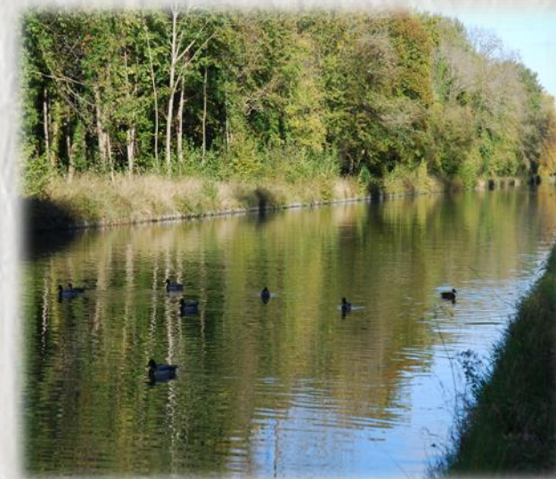
Canal du Loing

Partez à la découverte de la vie des bateliers au confluent de la Seine et du Loing. Vous en verrez peut-être sur leur péniche, qu'elle soit à quai ou au passage d'une écluse.