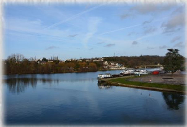
Confluent de la Seine et du Loing à Saint-Mammès

Crée en 1884, le club, membre de la Fédération Française de Joutes depuis 1960, s'attache à conserver l'aspect folklorique de ce sport, tout en s'imposant au plus haut niveau sportif, avec de multiples champions de France.