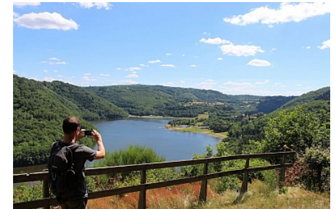
Belvédère de Roche Grande