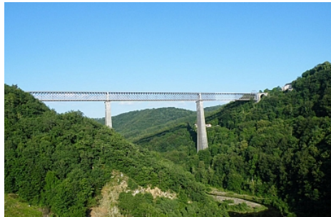
Viaduc des Fades_01 Combrailles

L'un des lieux incontournables des Combrailles ! Le barrage des Fades-Besserve crée la retenue d'eau permettant la baignade et les loisirs nautiques en été, et la pêche toute l'année. Il a été mis en eau en 1969 pour la production d'électricité. Le lac créé par le barrage est étendu sur 15km de long et 385 hectares. Face à vous se trouve le majestueux Viaduc des Fades, le géant des Combrailles avec ses 132,50 mètres de haut. Mis en service en 1909 après 8 ans de travaux, il permettait la liaison régulière entre Clermont-Ferrand et Montluçon jusqu'en 2007. Son tablier métallique, porté par 2 gigantesques piles de pont en maçonnerie traditionnelle, mesure 375 mètres de long, et reflète le labeur ancestral de l'Homme pour s'adapter aux contraintes naturelles. Mais le plus haut Viaduc ferroviaire de France, inscrit au titre des monuments historiques, se dégrade lentement, rongé par la rouille, et depuis 1992 l'association Sioule et Patrimoine œuvre pour sa conservation et sa sauvegarde. Une fiche patrimoine de la collection « Trésors des Combrailles » présente l'histoire de la construction du barrage et du Viaduc (en vente à l'Office de tourisme des Combrailles).