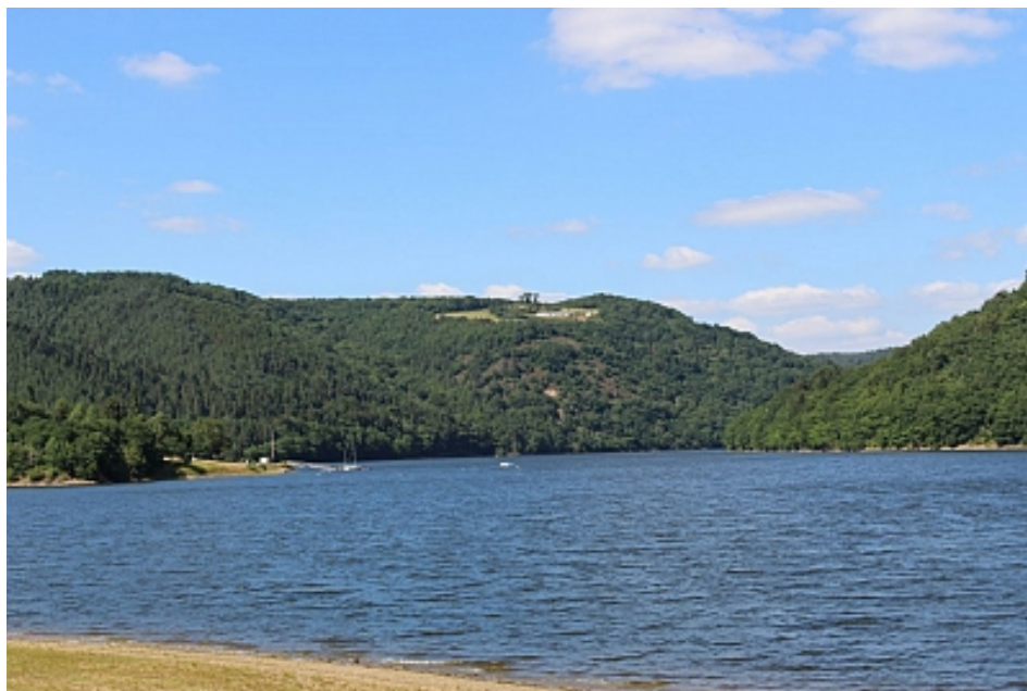
La Chazotte_OT Combrailles

Vous pouvez faire une halte à la plage de la Chazotte pour profiter de la vue sur la lac des Fades. Plage, aire de pique-nique, aire de jeux sur place, ainsi qu'un bar-restaurant ouvert en saison.