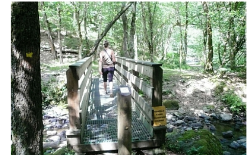
Chemin d'accès_01 Combrailles