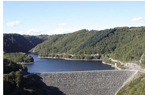
Barrage des Fades_Mairie des Ancizes-Comps