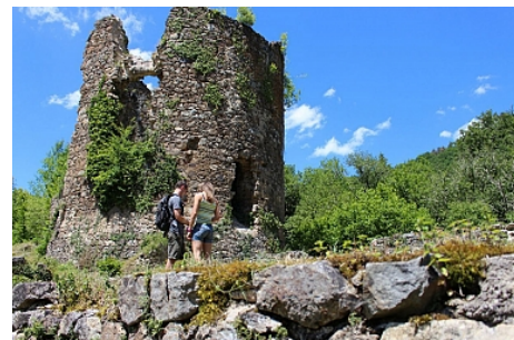
Ruines de la Chartreuse_OT Combrailles

Nichées au creux de la vallée de la Sioule, dans un lieu paisible qui invite au ressourcement, les ruines de la Chartreuse du Port-Sainte-Marie sont les vestiges d'un monastère très important pour la région des Combrailles. Fondé en 1219 par Raoul et Guillaume de Beaufort, le monastère va au fil des siècles étendre son emprise sur la région, avec un rayonnement économique et territorial important. Explorez les ruines au gré des panneaux informatifs pour marcher dans les pas des Chartreux. Le site, classé au titre des Monuments Historiques, est restauré année après année grâce aux actions de l'association « les Amis de la Chartreuse du Port-Sainte-Marie ». N'hésitez pas à emprunter le chemin qui emmène en bord de Sioule, pour découvrir cette rivière, encore sauvage à cet endroit, qui sera retenue en aval par le barrage des Fades-Beserve.