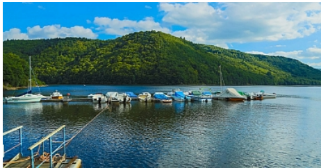
Vue sur la lac des Fades_Pont du Bouchet_Elyas Saens

Faites une halte au Pont-du-Bouchet pour découvrir une des parties aménagées du lac des Fades-Besserve. Une balade à pieds est possible (départ à côté du rond-point, balises en papillons jaune) jusqu'à la plage de Confolant (aller-retour : 5 km). En accédant à la plage vous trouverez aire de pique-nique, aire de jeux pour enfants et zone de baignade.