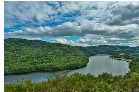
Belvédère de Roche Grande_Elyas Saens

Etape panorama ! Entre le Pont-du-Bouchet et Miremont, une pause s'impose pour profiter d'une vue imprenable sur le lac et les plages de Confolant et de la Chazotte !