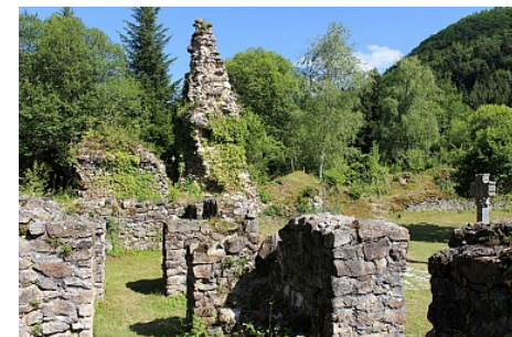
Ruines de la Chartreuse_OT Combrailles