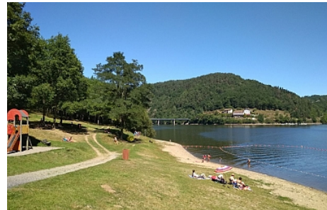
Plage du Pont du Bouchet_OT Combrailles