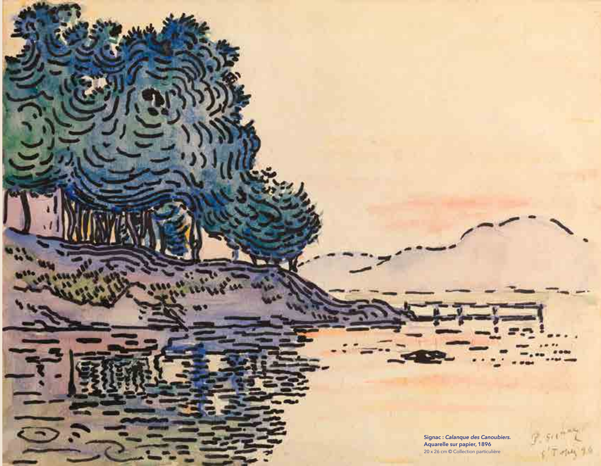
Signac : Calanque des Canoubiers. Aquarelle sur papier, 1896 20 x 26 cm