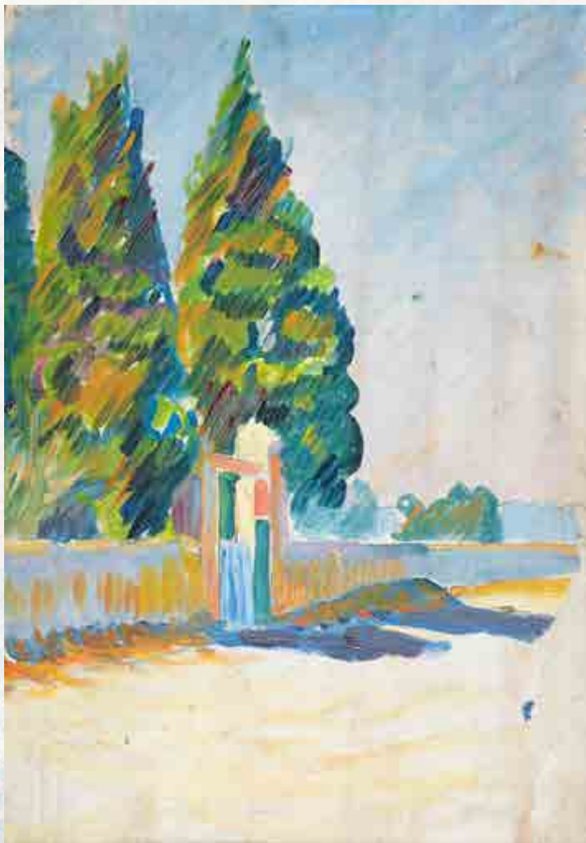
Signac : Étude pour Les Deux Cyprès . Huile sur bois, 1893 27 x 18 cm

1890 Janvier : Il est à Bruxelles pour l'ouverture du Salon des XX. Avec Toulouse-Lautrec, il s'oppose au peintre Henry de Groux qui a tenu des propos déplaisants sur Van Gogh, taxé « d'inénarrable pot de soleils ».