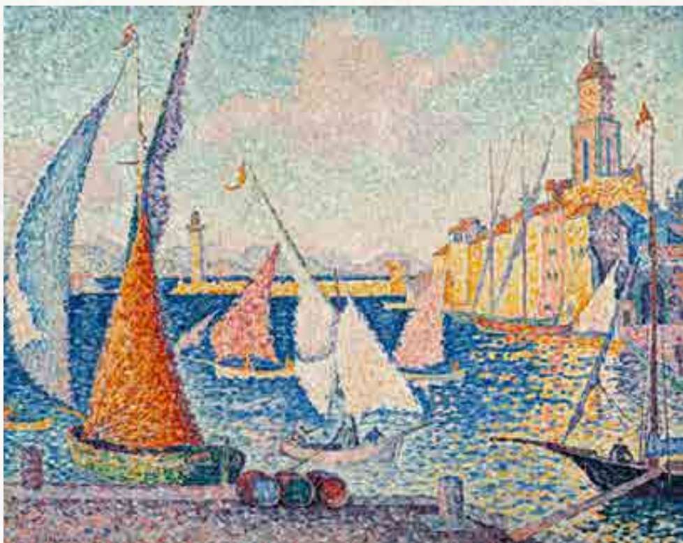
Signac : Saint-Tropez, le quai . Huile sur toile, 1899 65 x 81 cm

En 1902, il présente près d'une centaine d'aquarelles à la galerie Bing (Paris), il signe de plus en plus Signac aquarelliste à partir de 1910 et cela devient une production prédominante par rapport aux œuvres peintes. Il ne réalise alors que 1 à 4 tableaux par an, et ne présente que ce type d'œuvres à la galerie Bernheim-Jeune (Paris) en 1911.