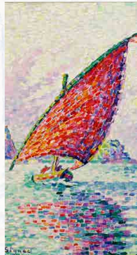
Signac : Marseille, barques de pêche, ou Le Fort Saint-Jean . Huile sur toile, 1907 (détail) 50 x 61 cm © Musée de l'Annonciade, Saint-Tropez

18 août : Ses cendres sont déposées au cimetière du Père-Lachaise à Paris.