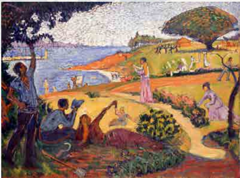
Signac : Esquisse pour Au temps d'harmonie. Huile sur toile, 1893 58,6 x 81 cm

que l'œuvre soit rebaptisée avant d'être exposée au Salon des indépendants de 1895. Avec cette très grande toile, Signac s'est lancé un défi et son écriture s'en retrouvera changée à l'issue du terme de sa réalisation en 1895. Cette évolution se marque par un éloignement progressif d'une écriture trop technique au niveau de la division de la couleur. Il prend peu à peu ses distances avec le pur néo-impressionnisme tel qu'il le pratiquait avec Seurat.