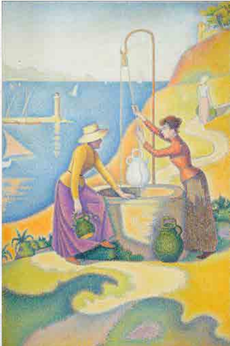
Signac : Les femmes au puits . Huile sur toile, 1892