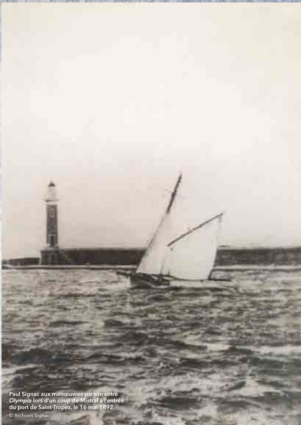
Paul Signac aux manœuvres sur son cotre Olympia lors d'un coup de Mistral à l'entrée du port de Saint-Tropez, le 16 mai 1892.