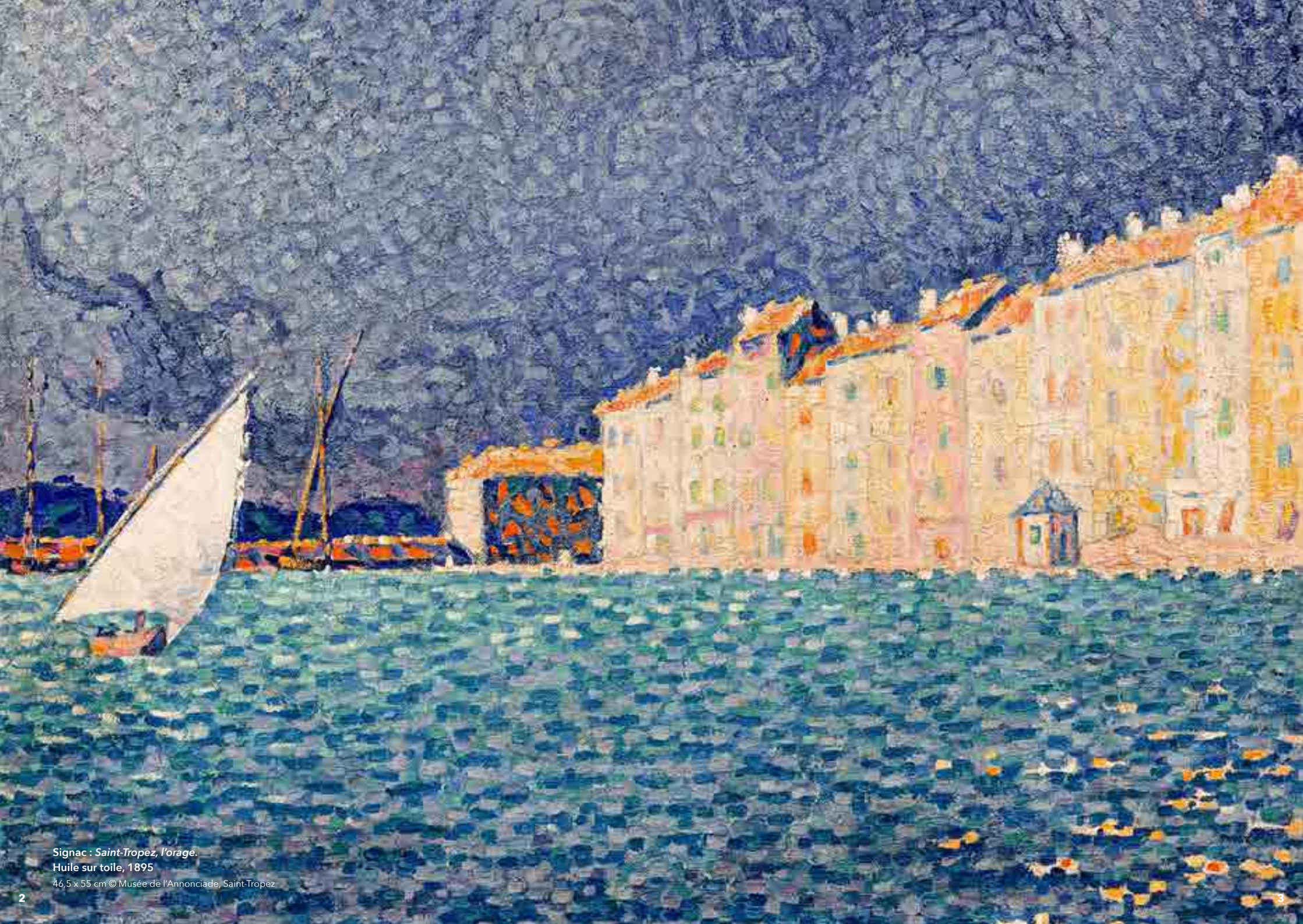
Signac : Saint-Tropez, l'orage . Huile sur toile, 1895 46,5 x 55 cm