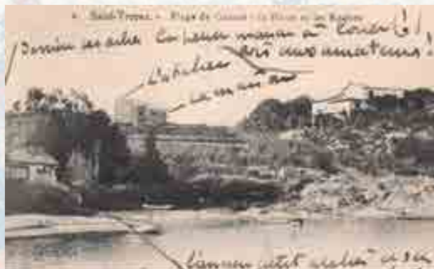
Carte postale annotée par Paul Signac 9 x 14 cm

l'été. La même année, il rencontre Berthe Roblès (1862-1942), une cousine éloignée de Camille Pissarro, modiste jusqu'en 1889, qui deviendra sa compagne.