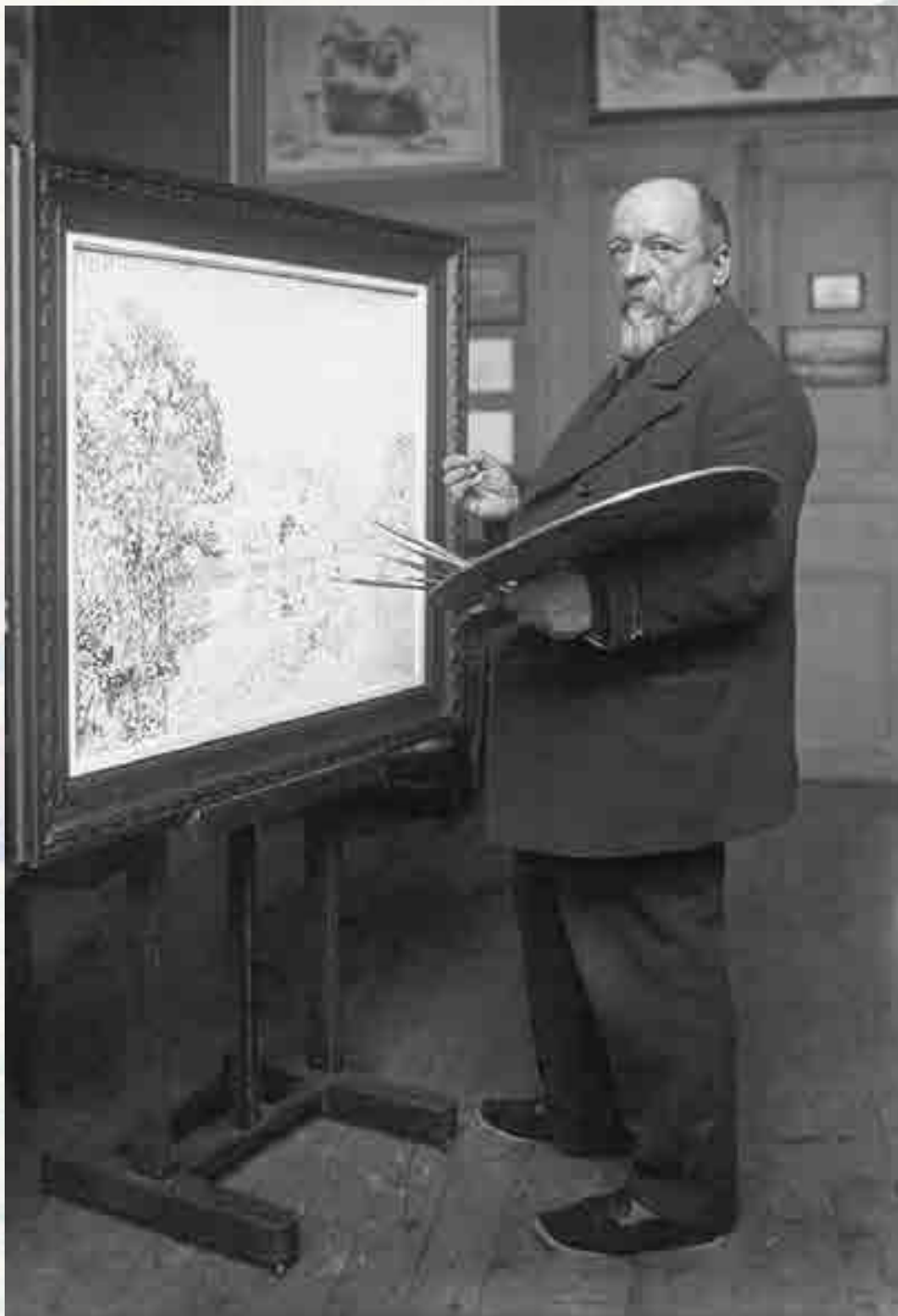
Paul Signac, 1923, par l'Agence de presse Meurice