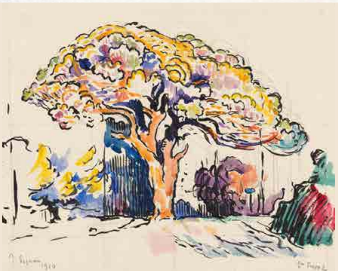
Signac : Le Pin de Bertaud . Aquarelle, 1910 25,5 x 32 cm

Décembre : Il participe sans succès au concours d'esquisses destinées au décor de la mairie d'Asnières.