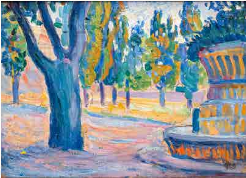
Signac : Étude pour la Fontaine des Lices. Huile sur bois, 1895 18.8 x 27 cm