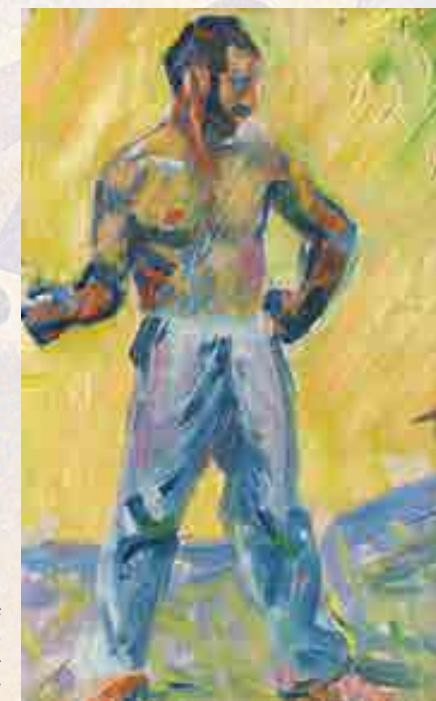
Signac : Étude du joueur de boules pour Au temps d'harmonie. Huile sur bois, 1894 25 x 15,5 cm