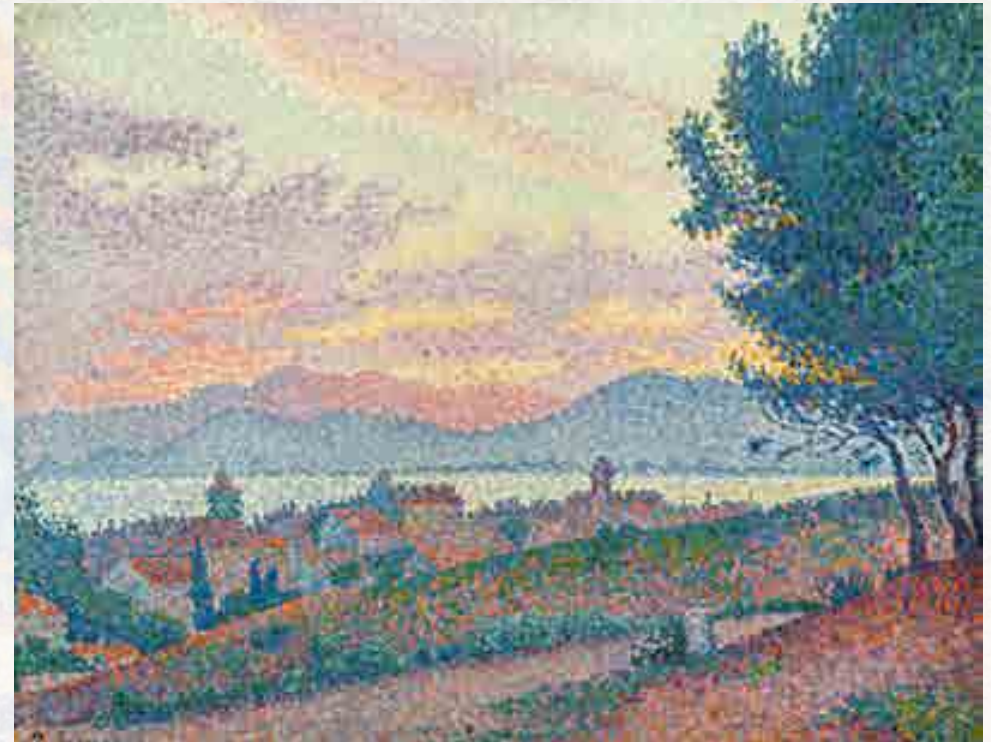
Signac : Vue de Saint-Tropez, coucher de soleil au bois de pins . Huile sur toile, 1896

Les paysages baignés de lumière dont les variations sont traitées selon la technique divisionniste font entrer Saint-Tropez dans