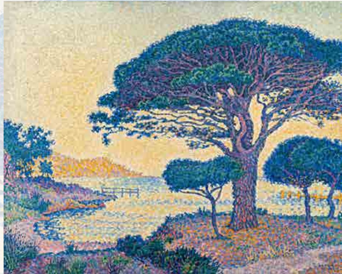
Signac : Saint-Tropez, les pins parasols aux Canebiers. Huile sur toile, 1897 65 x 81 cm © Musée de l'Annonciade, Saint-Tropez

marquant durablement l'art moderne au tournant du XX e siècle. Les œuvres de la collection de l'Annonciade sont révélatrices de l'abandon progressif de la touche en petit point si chère à Seurat pour se libérer en une touche plus large, donnant un effet de compartimentage type tesselles de mosaïque.