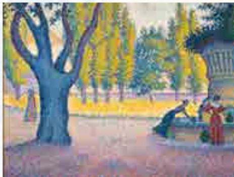
Signac : Saint-Tropez. Fontaine des Lices. Huile sur toile 1895 65 x 81 cm © Collection particulière Non présenté lors de l'exposition

Cela lui est d'autant plus aisé grâce à son rôle et l'influence dans le monde artistique qu'il exerce quand il devient le Président de la Société des artistes indépendants en 1908.