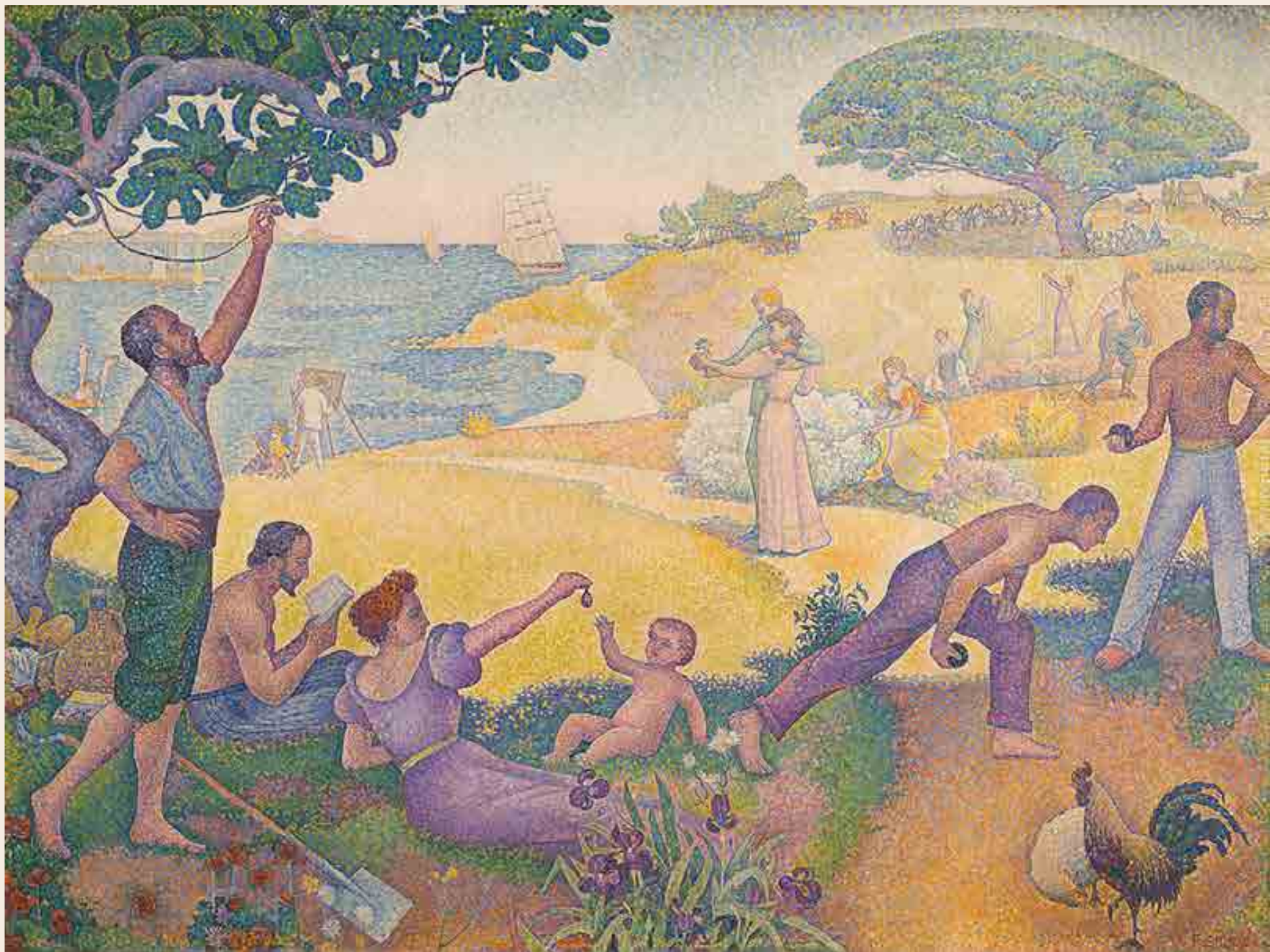
Signac : Au temps d'harmonie : l'âge d'or n'est pas dans le passé, il est dans l'avenir. Huile sur toile réalisée entre 1893 et 1895 310 x 410 cm © Mairie de Montreuil Non présenté lors de l'exposition