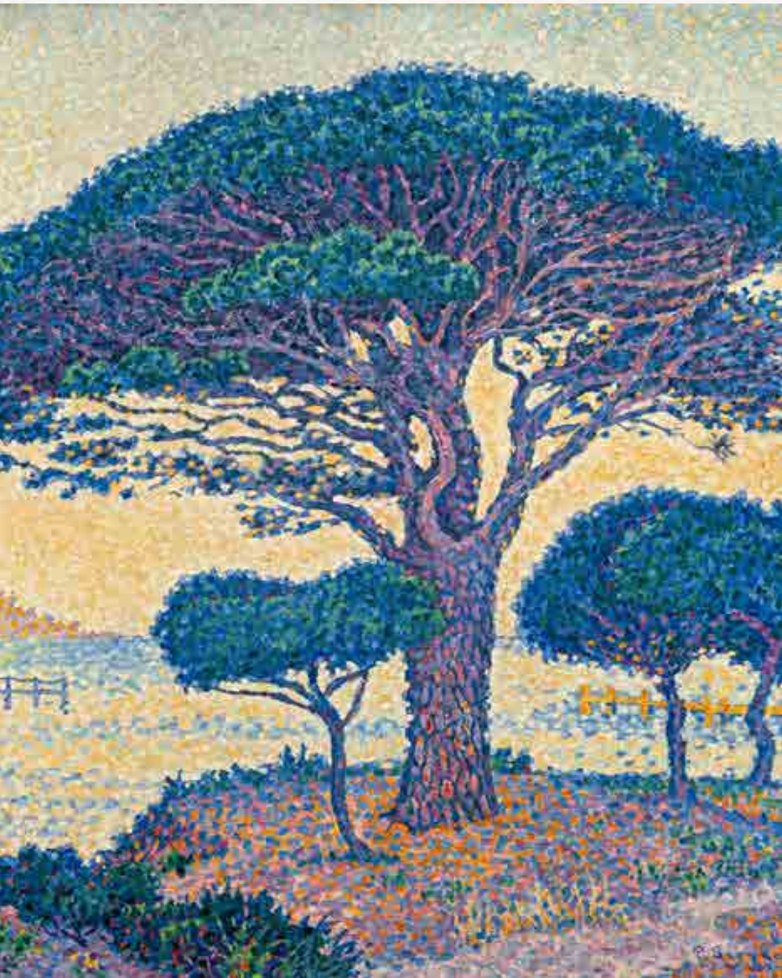
Signac : Saint-Tropez, les pins parasols aux Canebiers. Huile sur toile, 1897 (détail) 65 x 81 cm

Août : Charles Henry publie « Introduction à une esthétique scientifique » dans la Revue contemporaine .