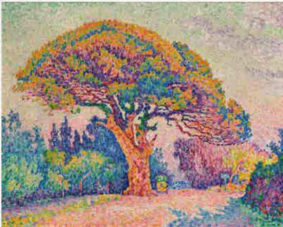
Signac : Le Pin de Bertaud . Huile sur toile, 1909

72 x 92 cm © Musée des Beaux-Arts Pouchkine