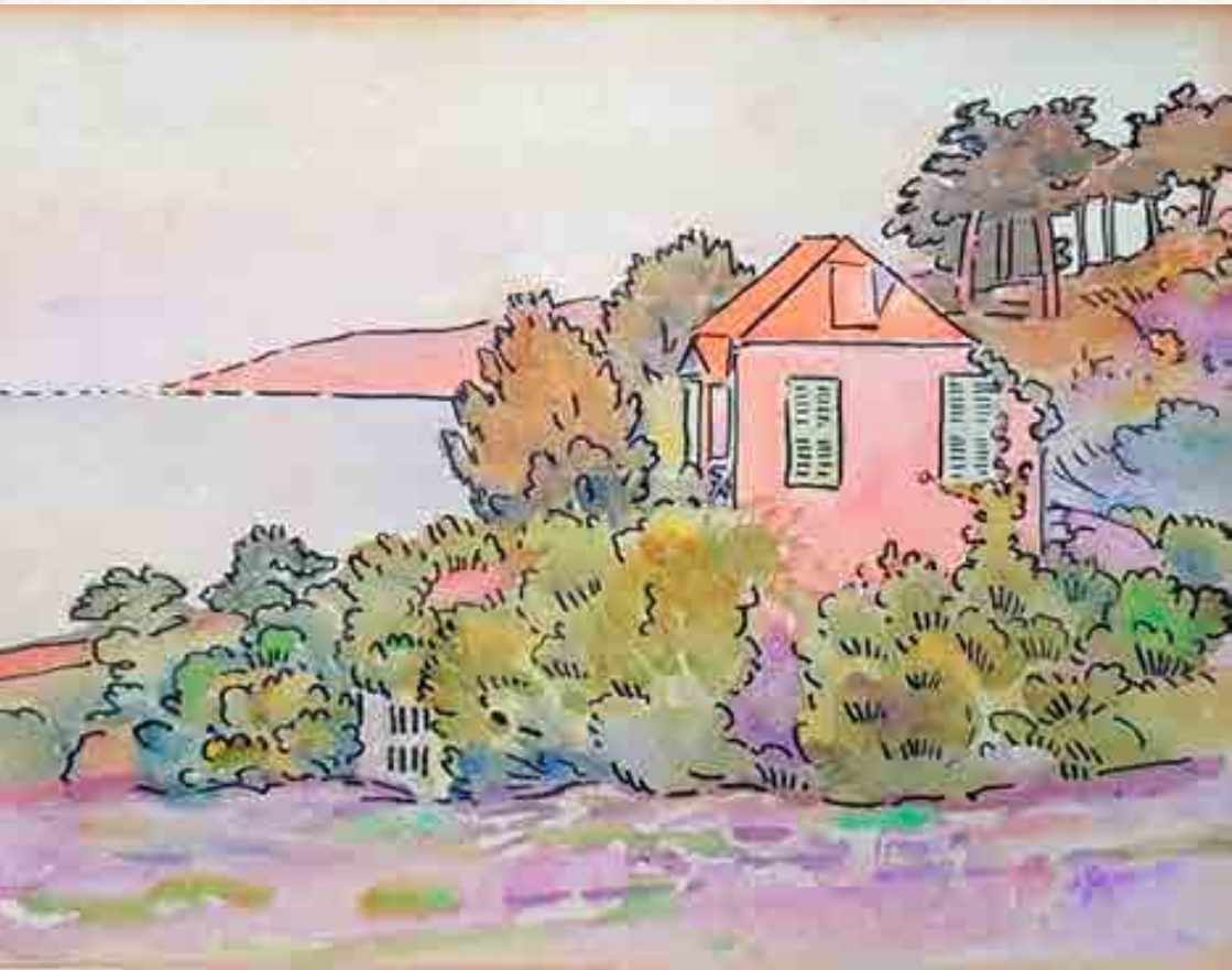
Signac : La maison rose, La Ramade, Saint-Tropez. Aquarelle et encre sur papier, vers 1892 20 x 26 cm © Collection particulière