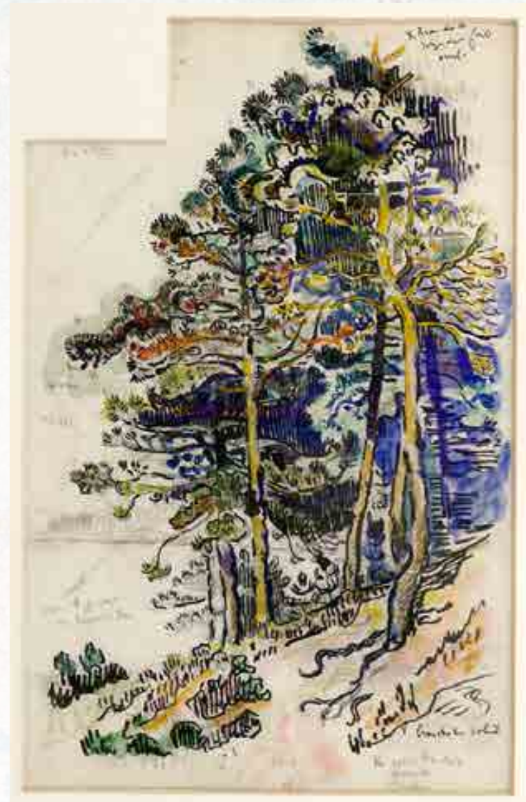
Signac : Saint-Tropez, le sentier côtier . Aquarelle, encre et mine de plomb sur papier, vers 1901 43,5 x 27,8 cm © Musée de l'Annonciade, St-Tropez

Ce genre de réalisation fait partie d'un type d'aquarelle considéré comme des études annotées utiles pour mémoriser des évocations colorées et des structures paysa-