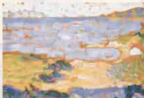
Signac : Étude de la plage pour Au temps d'harmonie. Huile sur bois, 1894 26 x 35 cm © Collection particulière