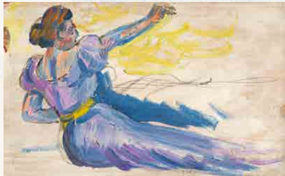
Signac : Étude de la femme allongée pour Au temps d'harmonie. Huile sur bois, 1894 15,5 x 25 cm © Collection particulière

Ce paysage réinventé par rapport au site est une création libre pour exprimer un paradis très personnel. Un monde heureux, libre et égalitaire qui peut devenir possible grâce à l'anarchie. C'est ainsi que Signac nomme à l'origine ce tableau Au temps d'anarchie . Les événements de l'époque et l'assassinat du président Sadi Carnot par un anarchiste, amènent à ce