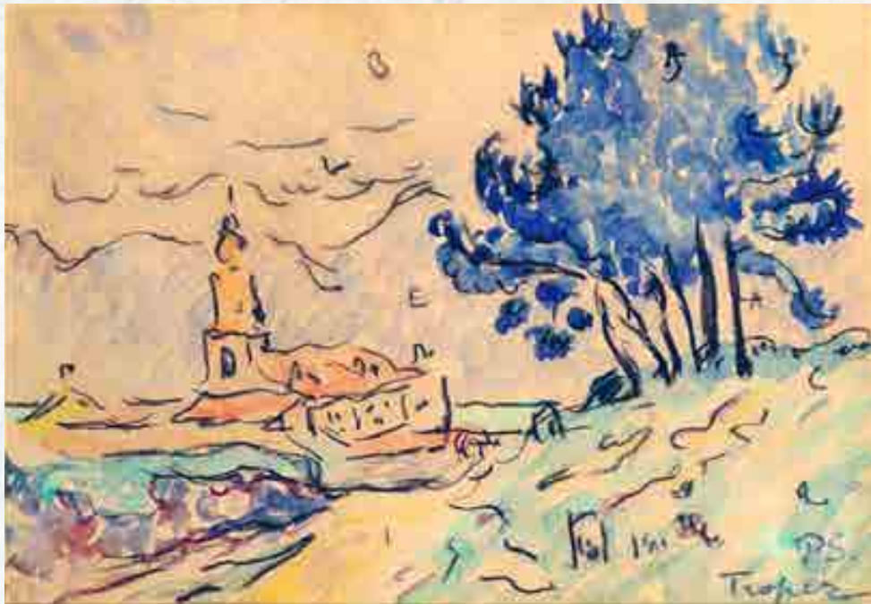
Signac : Vue de Saint-Tropez . Aquarelle et mine de plomb sur papier, vers 1896 11,5 x 16,5 cm