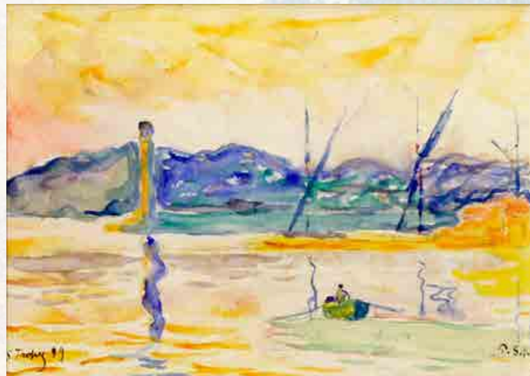
Signac : L'entrée du port de Saint-Tropez au soleil couchant . Aquarelle sur papier, 1899 18 x 25.5 cm

1913 marque un tournant dans sa sphère privée et induit la séparation avec son épouse Berthe, à qui il confie la Hune , pendant qu'il s'installe à Antibes avec sa compagne Jeanne Selmershein et la petite fille née de leur union, Ginette.