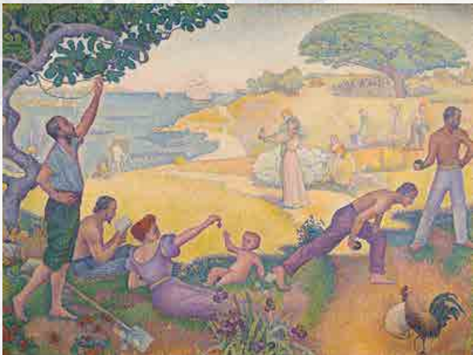
Signac : Au temps d'harmonie : l'âge d'or n'est pas dans le passé, il est dans l'avenir. Huile sur toile entre 1893 et 1895 310 x 410 cm © Mairie de Montreuil Non présenté lors de l'exposition

picturalement sur une grande toile tant ses idées, que la révélation de la couleur procurée par ces lieux idylliques.