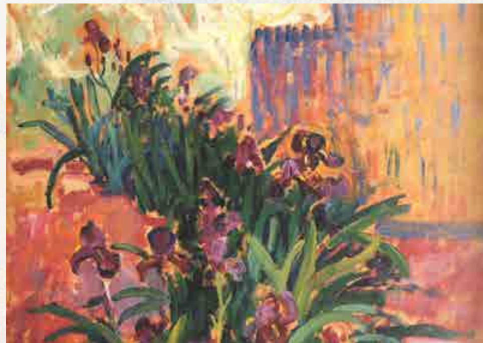
Signac : Étude des iris pour Au temps d'harmonie. Huile sur bois, 1894 26 x 35 cm

Il a d'autant plus encouragé ce mouvement qu'après avoir accueilli Henri Matisse à Saint-Tropez lors de l'été 1904 en lui montrant la voie du divisionnisme et de la couleur, il encourage les jeunes artistes de l'avant-garde tels que les fauves et les cubistes à poursuivre leurs travaux.