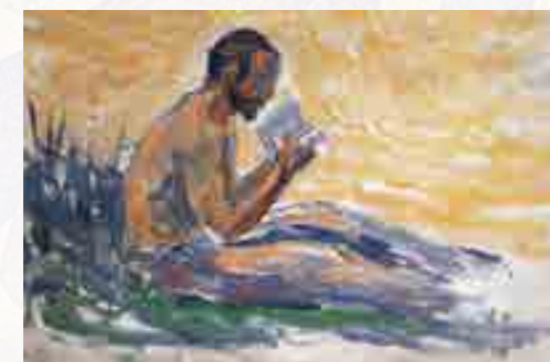
Signac : Étude du lecteur pour Au temps d'harmonie. Huile sur bois, 1894 15,5 x 25 cm