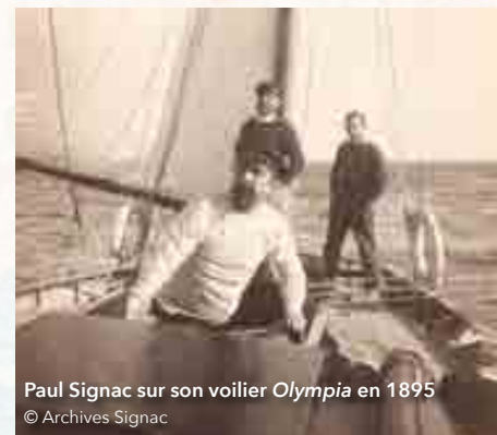
Paul Signac sur son voilier Olympia en 1895

On perçoit combien l'art pictural de ce mouvement se veut scientifique, réfléchi et non spontané.