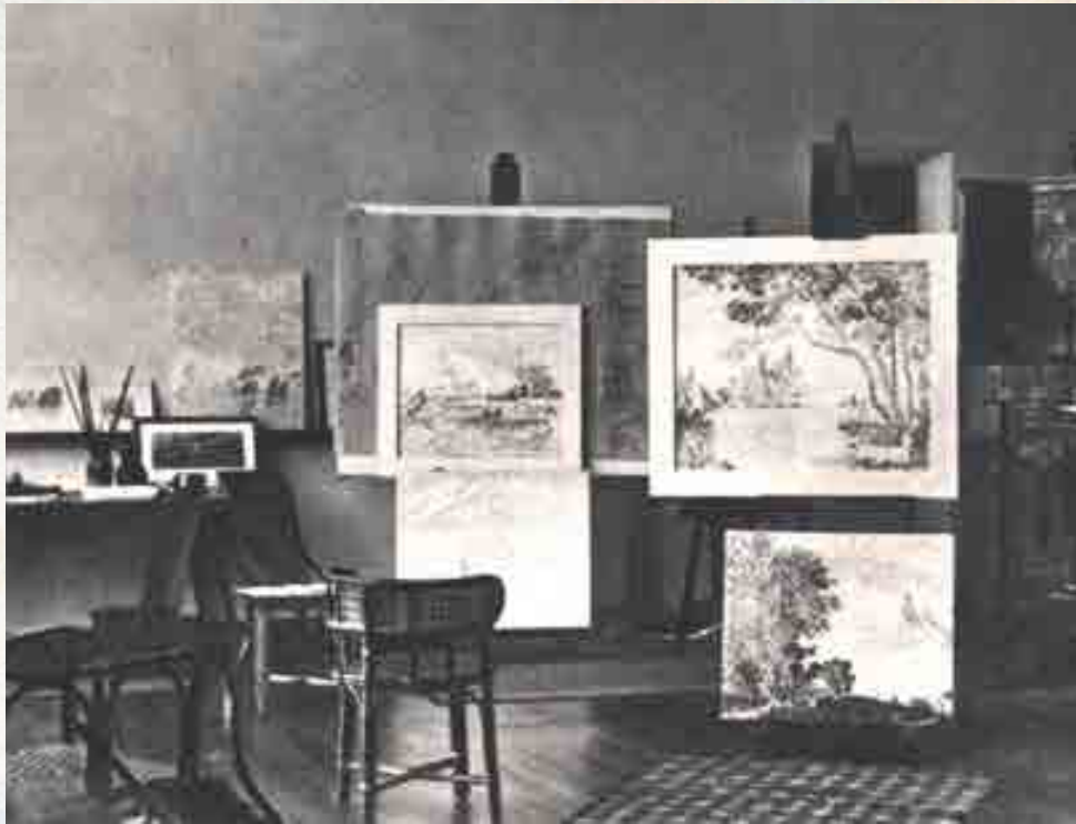
Atelier de Paul Signac à sa villa la Hune. 1903