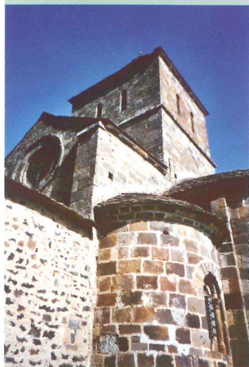
Église de Mauriac

Pédestre : difficile Longueur : 11 km Durée : 4 h 00 Dénivelé : 500 m Balise : jaune