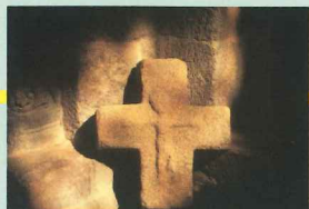
Croix : Église de Brageac

Ce sentier est au départ de Mauriac et de Brageac