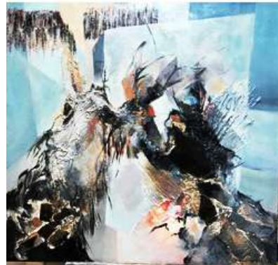
ESPACE PICTUR'HALLS TIELOR