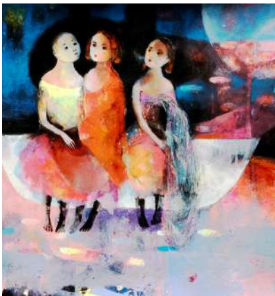
ESPACE PICTUR'HALLES ABIY