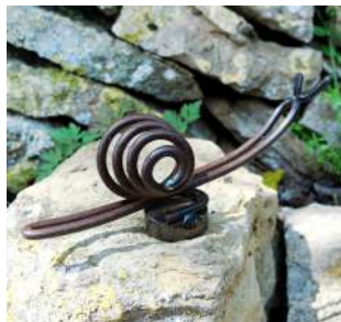
ESPACE PICTUR'HALLES ARTISTE À L'ANNÉE ARNAUD ROUILLOT