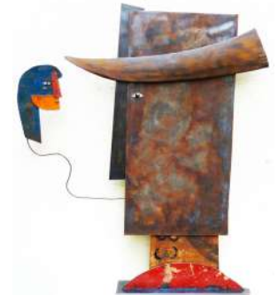
TOUR MÉDIÉVALE CHRISTOPHE