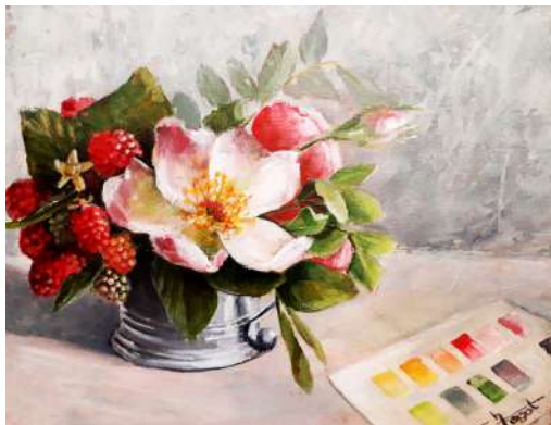
ESPACE PICTUR'HALLÉS CHRISTINE FAGOT