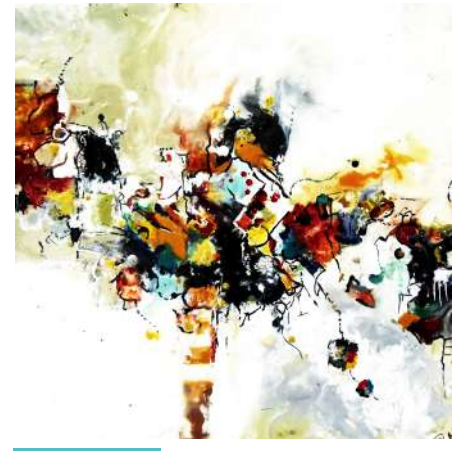
TOUR MÉDIÉVALE PATRICIA MOINE

TOUTES LES ŒUVRES EXPOSÉES SERONT DISPONIBLES À LA VENTE