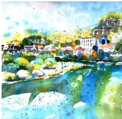
ESPACE PICTUR'HALLS MANDE ART