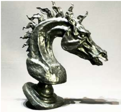
ESPACE PICTUR'HALLES ROBERT DI CREDICO