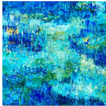
ESPACE PICTUR'HALLES CÉCILE WINDECK