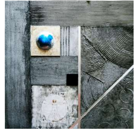
TOUR MÉDIÉVALE CAMILLE DUVILLARD

VERNISSAGE — VENDREDI 12 JUILLET 2024 18H - TOUR MÉDIÉVALE