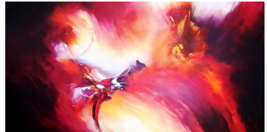
TOUR MÉDIÉVALE NADINE BERTULESSI