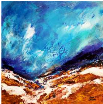
ESPACE PICTUR'HALLES ALAIN CLAUDIN