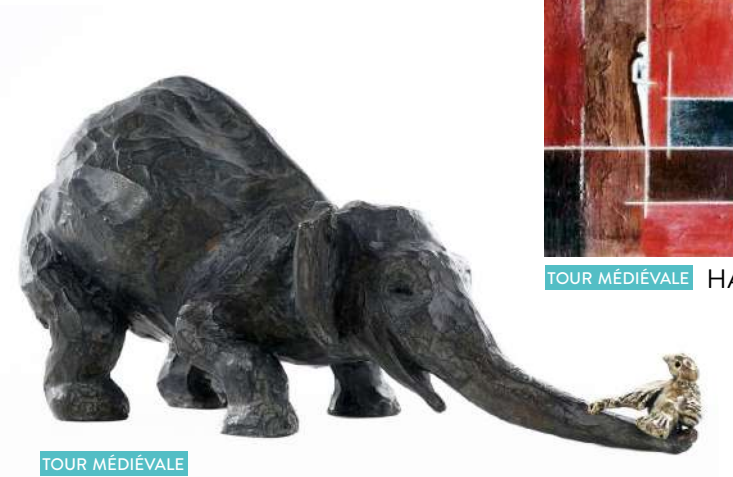
TOUR MÉDIÉVALE SOPHIE BARUT