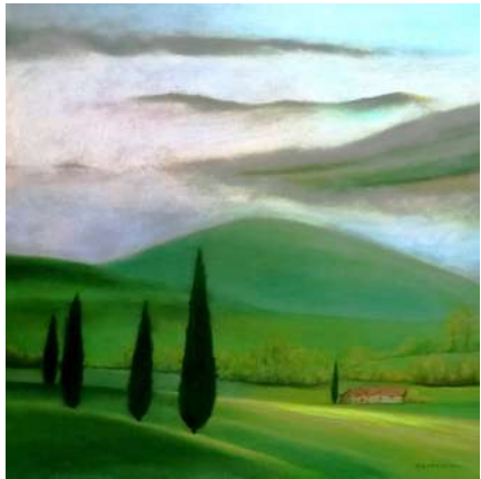
ESPACE PICTUR'HALLES ÉLISABETH BATAILLON