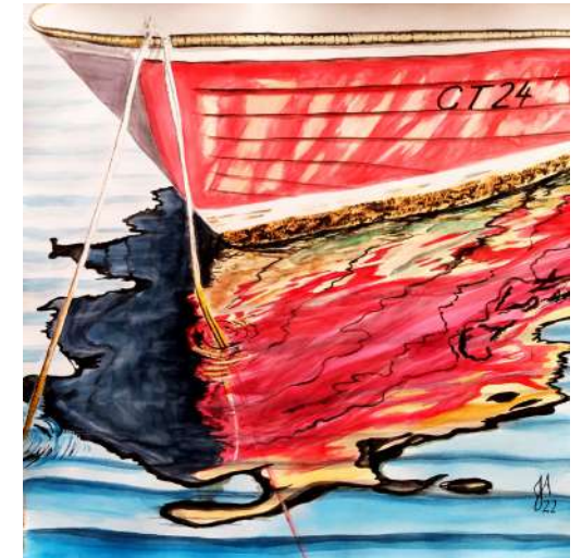
TOUR MÉDIÉVALE JANIE AMADORI