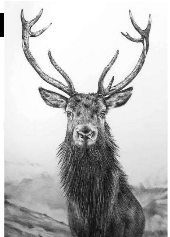
TOUR MÉDIÉVALE DAMIEN PACCALIN