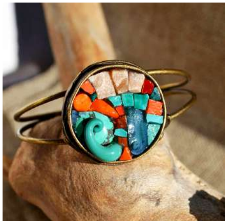
ESPACE PICTUR'HALLES ARTISTE À L'ANNÉE ESTELLE APPARU