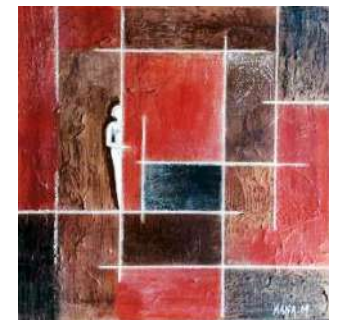
TOUR MÉDIÉVALE HANA.M