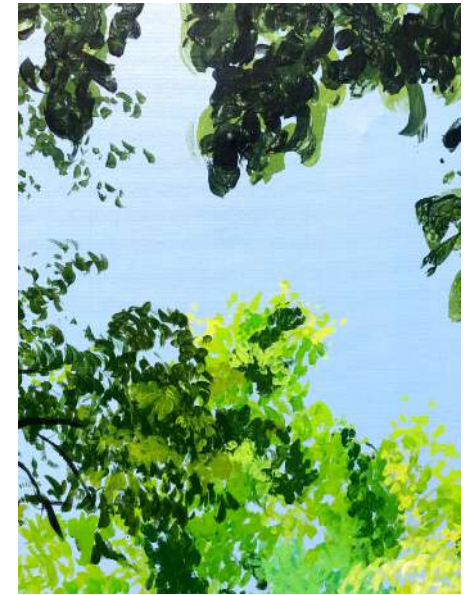
TOUR MÉDIÉVALE MARION SAGNES