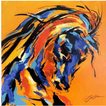
ESPACE PICTUR'HALLES ROBERT DI CREDICO