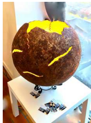
ESPACE PICTUR'HALLS LAURENCE TORO