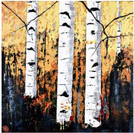
ESPACE PICTUR'HALLS VIRGINIE GAUTHIER