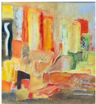
ESPACE PICTUR'HALLÉS FRANCINE SALMON