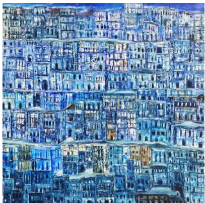
ESPACE PICTUR'HALLS JOSS BAHUAUD