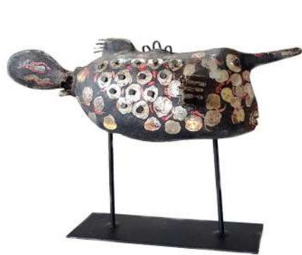
ESPACE PICTUR'HALLES MARTINE SAUSSE