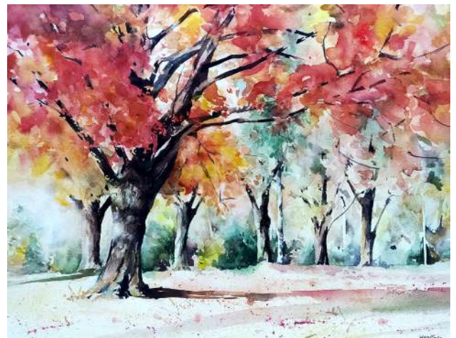
TOUR MÉDIÉVALE HÉLÈNE BASTARD