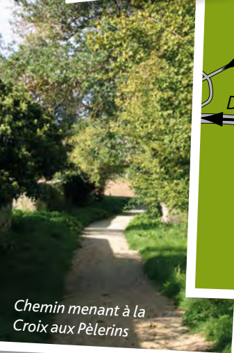
Chemin menant à la Croix aux Pèlerins