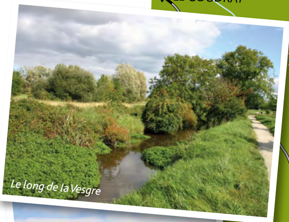
Le long de la Vesgre