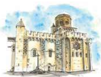
Église Saint-Léger

Le bourg de Royat est construit sur une coulée de basalte. Les murs qui la surplombent proviennent des remparts , dont seule une tour subsiste. Au pied de la paroi, la grotte des Laveuses abrite un lavoir naturellement alimenté par cinq sources minérales.