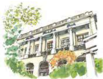
Théâtre © E. Heberstein EHTTA - Projet Source

Aujourd'hui, il possède une salle de jeux avec machines à sous, jeux traditionnels et brasserie.