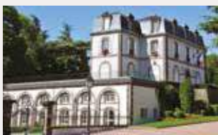
Hôtel de Ville Parc Montjoly

Ancien domaine constitué au XVI e siècle. En 1760, Michel Girard de la Bâtisse fait construire Le château, actuel hôtel de ville .