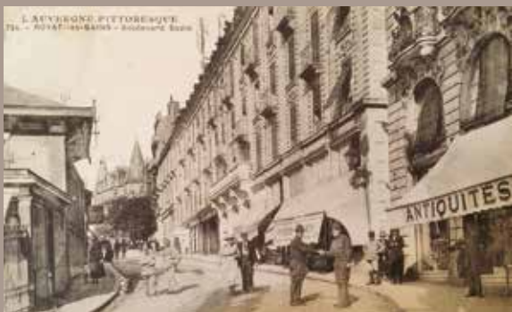
Boulevard Vaquez entre-deux-guerres

Construite en 1920 par l'architecte Guillot, la Taillerie de Royat est un bâtiment industriel situé à la sortie de la ville en direction du puy de Dôme. Ses ateliers sont agencés selon un parcours de visite permettant de voir scier, percer, tailler toutes les pierres semi-précieuses, puis visiter l'atelier de bijouterie et la boutique. Usine fermée en 2004.