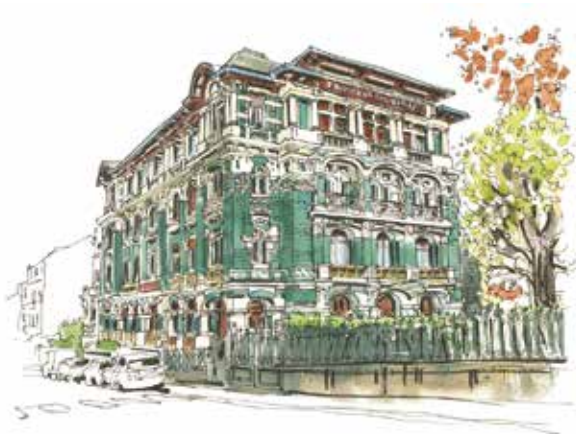
Pavillon Majestic

Le Pavillon Majestic , ancienne annexe du Grand Hôtel et Majestic Palace, est aménagé en 1912. Il possédait les premières salles de bains de la ville et le chauffage central à eau chaude. Cette modernité est affichée sur les façades par l'utilisation de briques émaillées vertes et blanches.