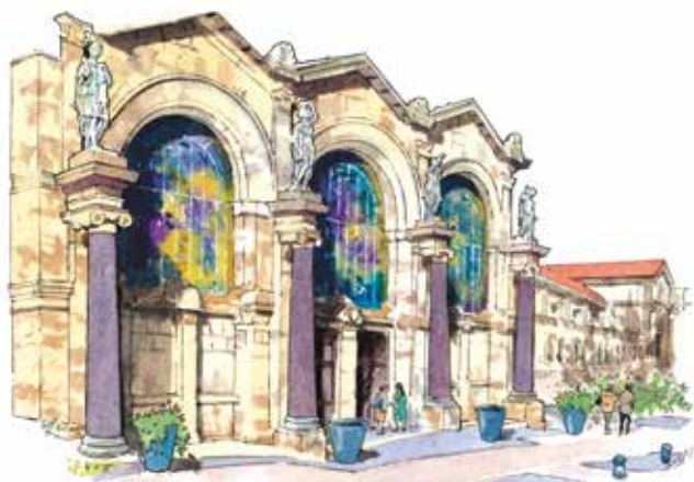
Thermes de Royat

Villas (privées) à découvrir aux numéros 74 bis, 86, 101, 103, 105, 111, 111 bis, 115 et 135 de cette avenue.