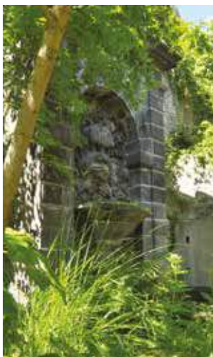
Fontaine au mascaron