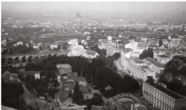
Point de vue depuis Le Paradis