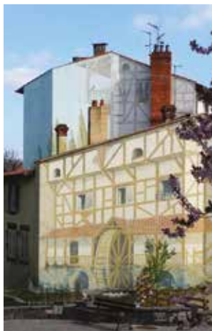
Œuvre de Sloba