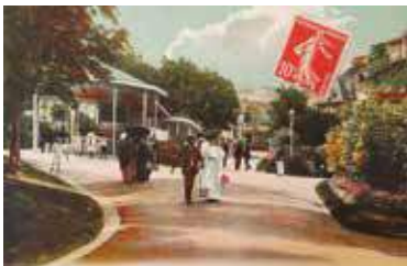
Parc thermal fin XIX e siècle

Aujourd'hui, l'établissement thermal, spécialisé dans le traitement des maladies cardio-artérielles et des rhumatismes, accueille chaque année plus de 8 000 curistes.