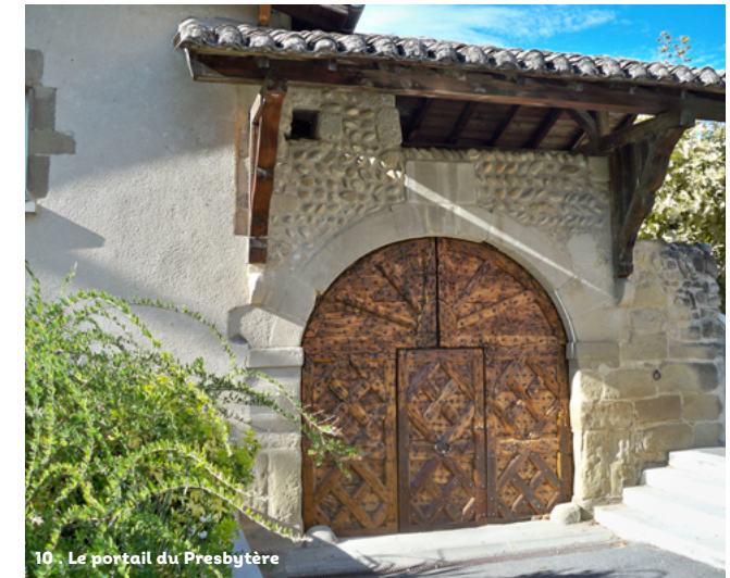
10 - Le portail du presbytère