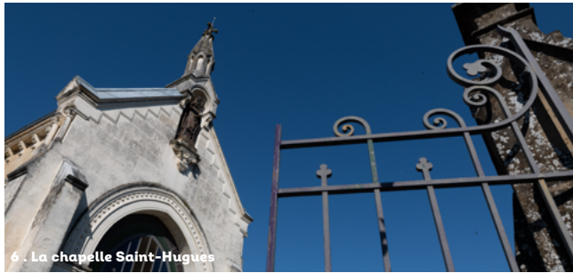
6 - La chapelle Saint-Hugues